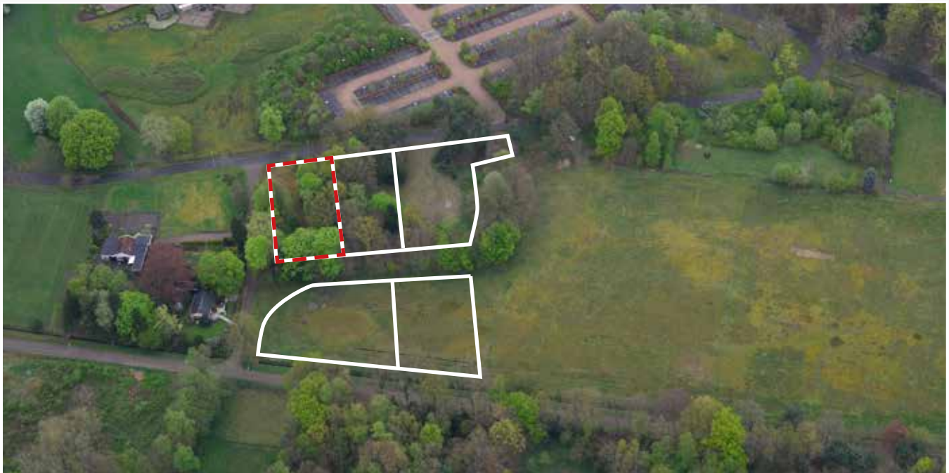
Kavel 90 vanuit de lucht