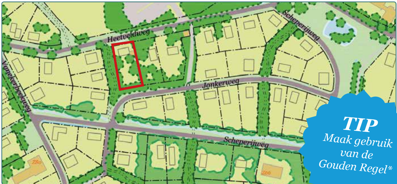
Situatietekening kavel 90