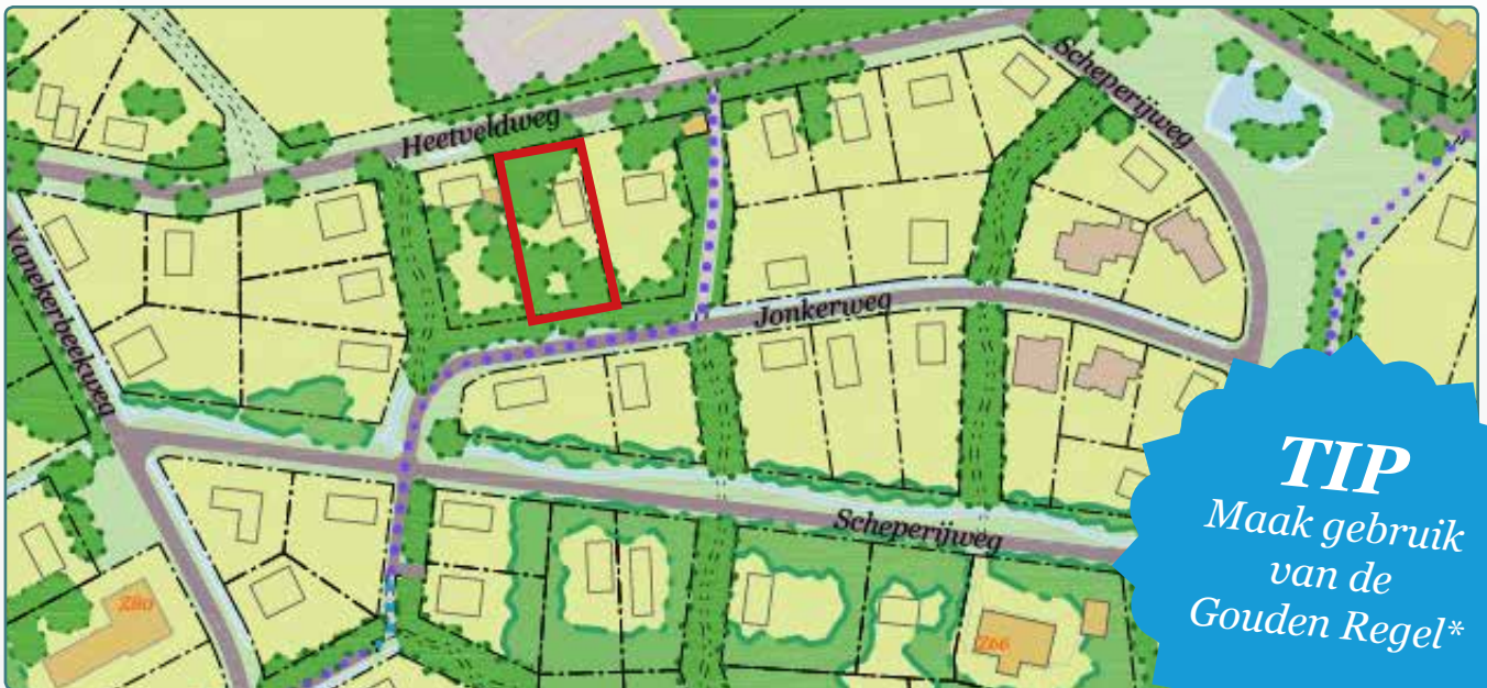
Situatietekening kavel 89