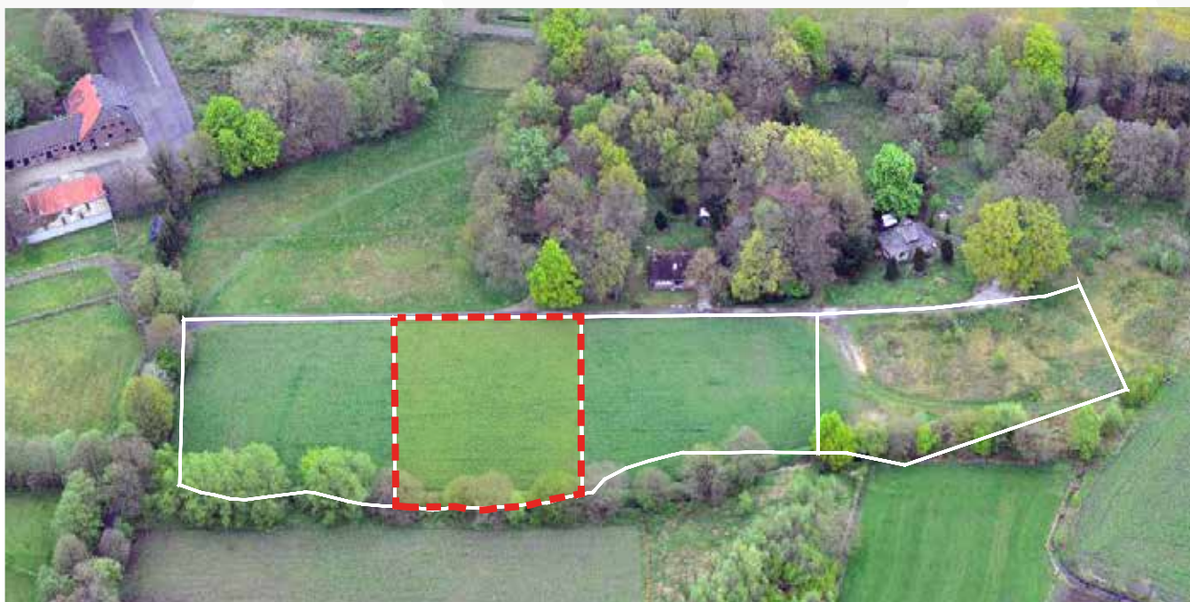
Kavel 85 vanuit de lucht