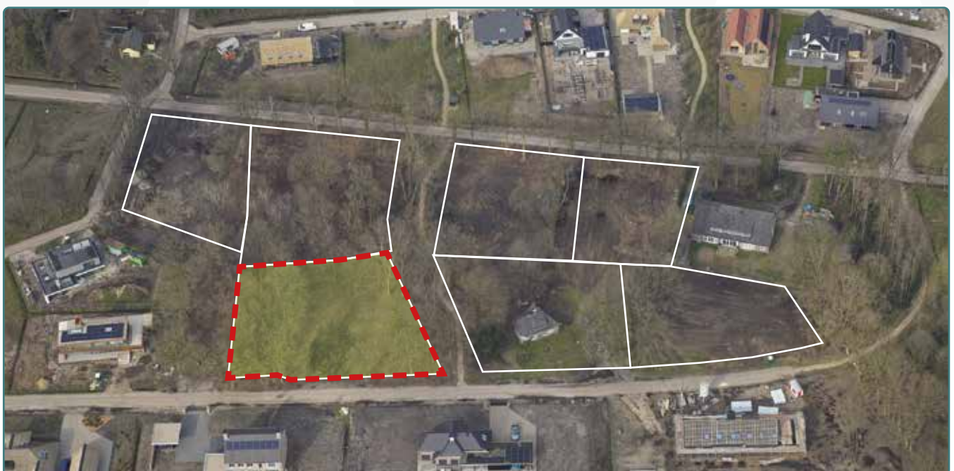
Kavel 147 vanuit de lucht