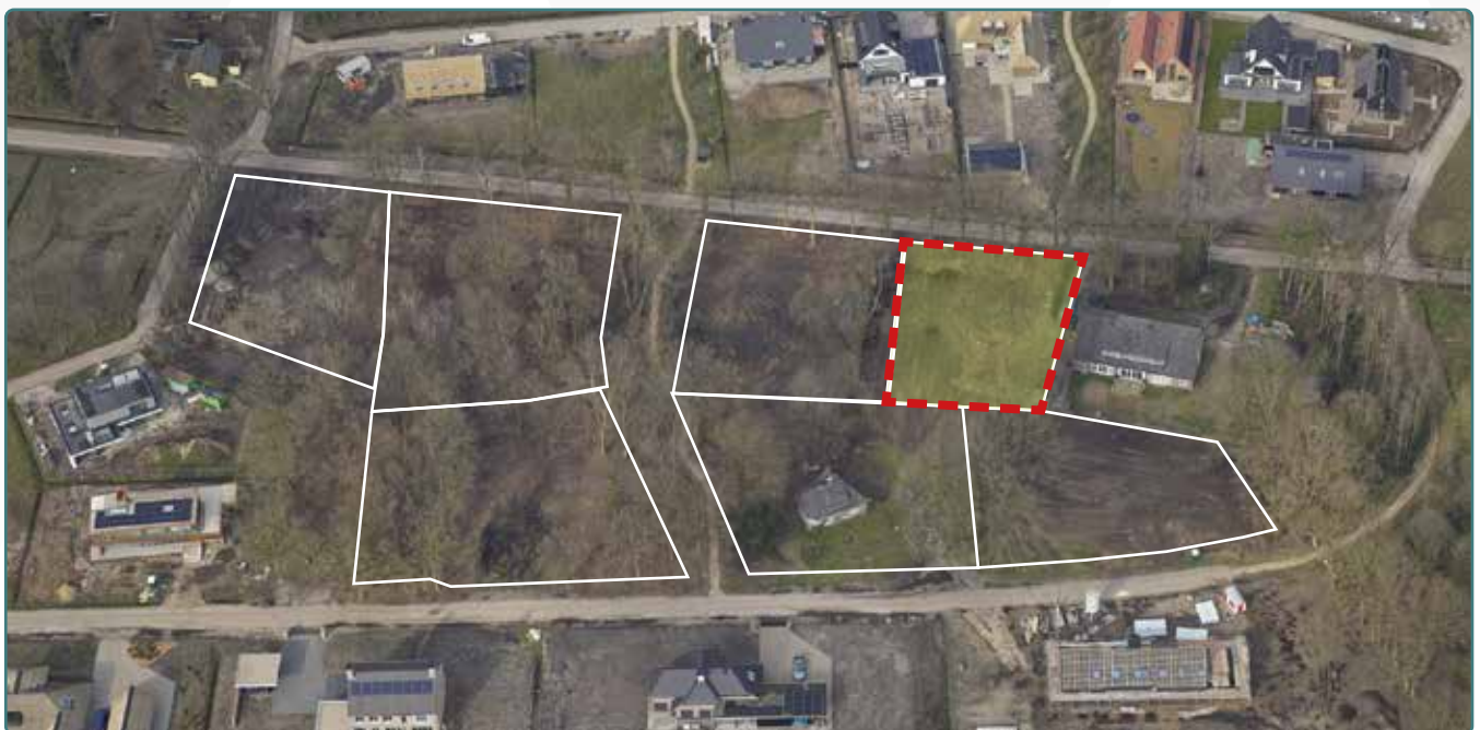
Kavel 144 vanuit de lucht

* De Stadsbouwmeester kan in zijn welstandsadvies afwijken van het beeldkwaliteitplan als de koper c.q architect met een ontwerp (aanvraag omgevingsvergunning) komt dat op onderdelen afwijkt van het beeldkwaliteitplan, maar kwalitatief een verrijking is van 't Vaneker. Dit is ter beoordeling aan de Stadsbouwmeester.