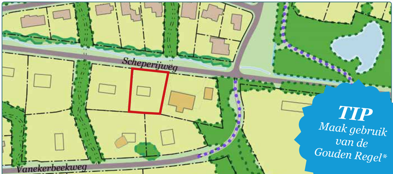
Situatietekening kavel 144