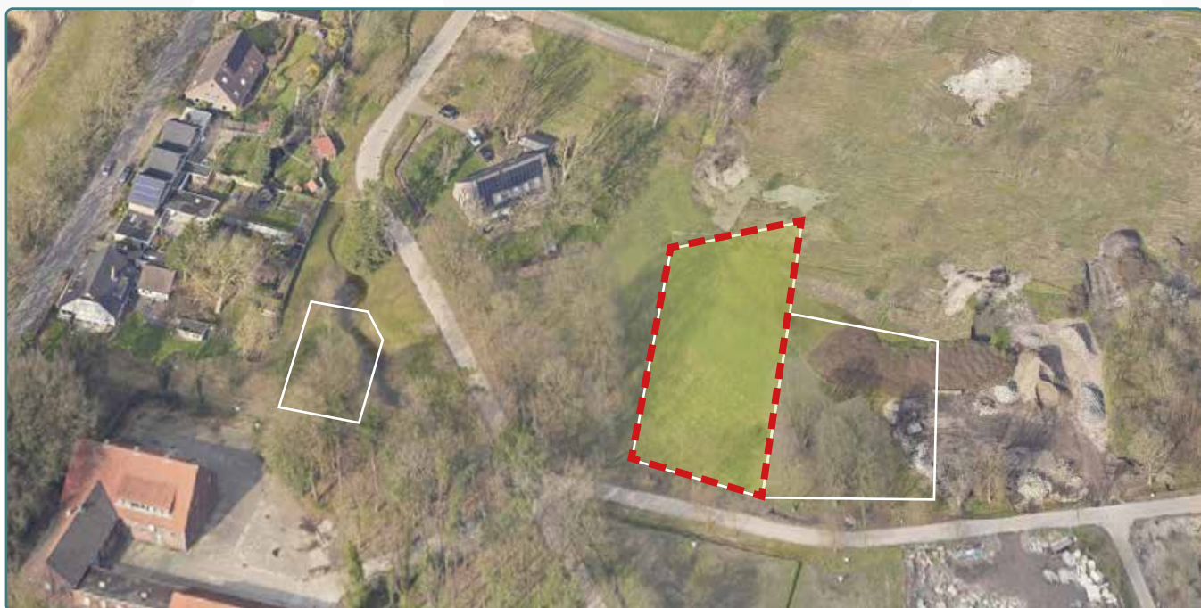
Kavel 139 vanuit de lucht