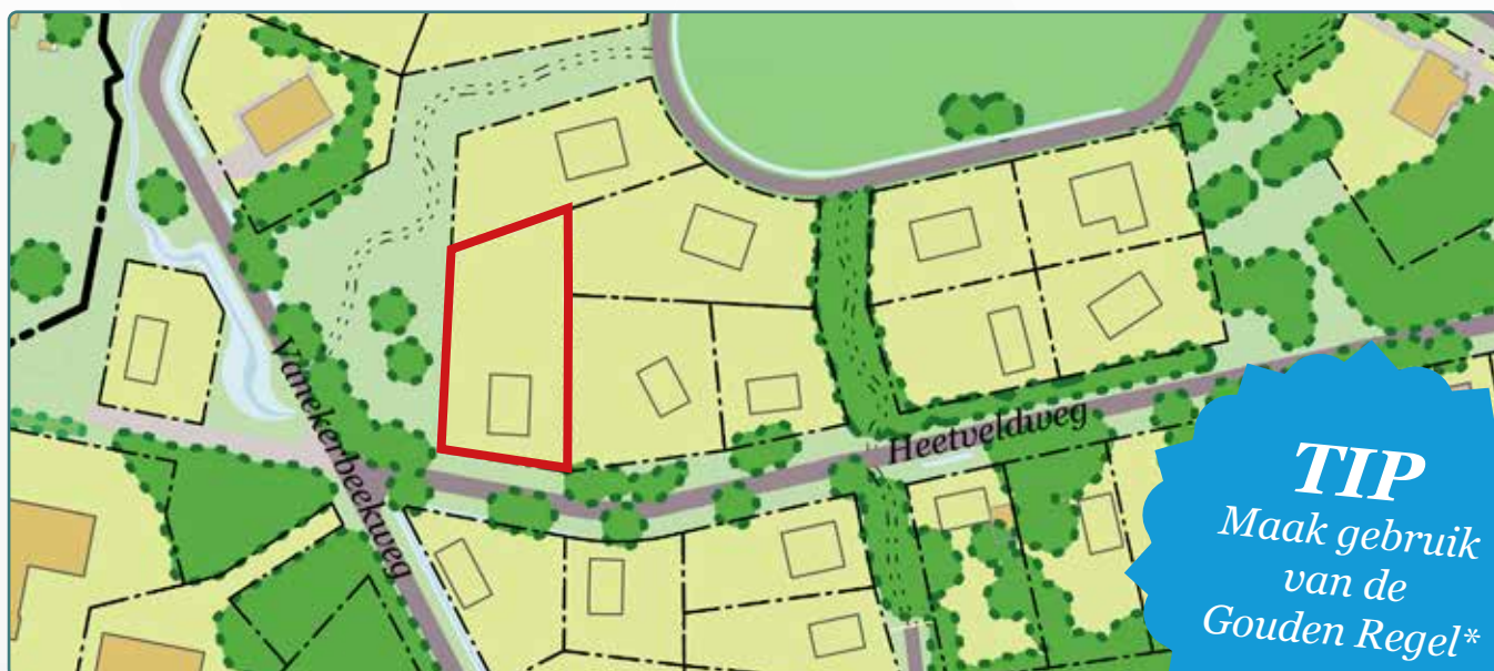
Situatietekening kavel 139