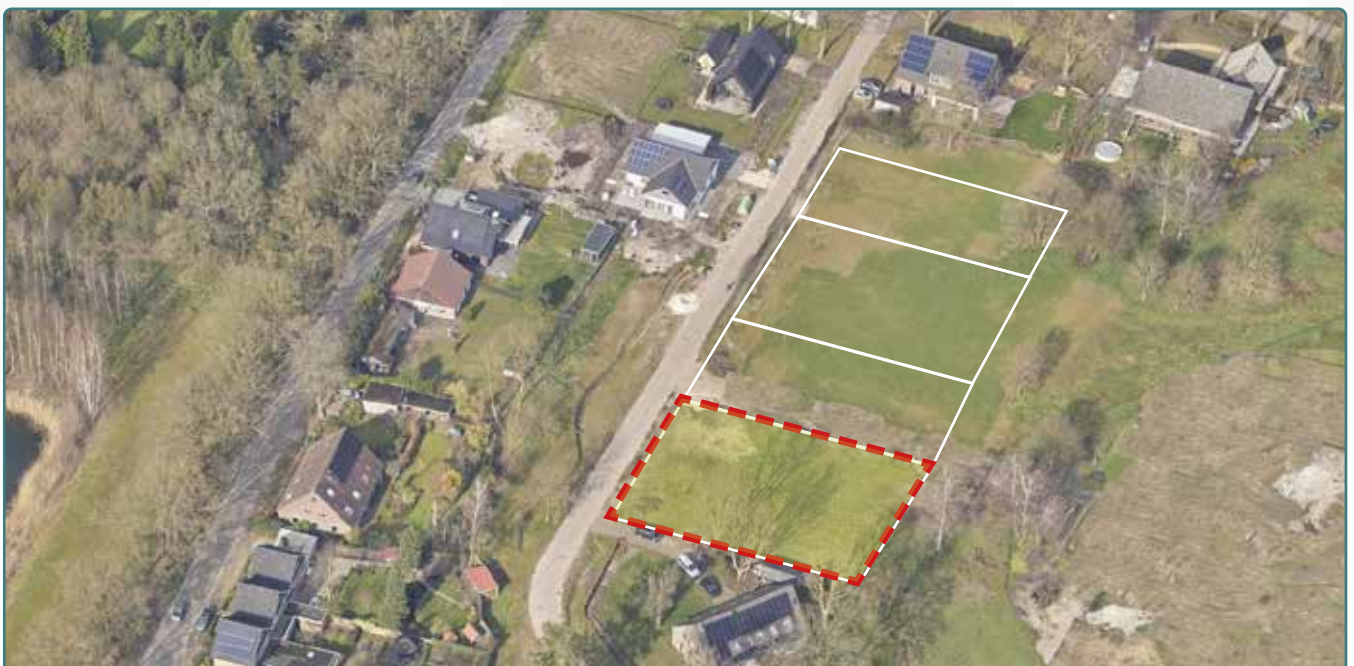
Kavel 137 vanuit de lucht