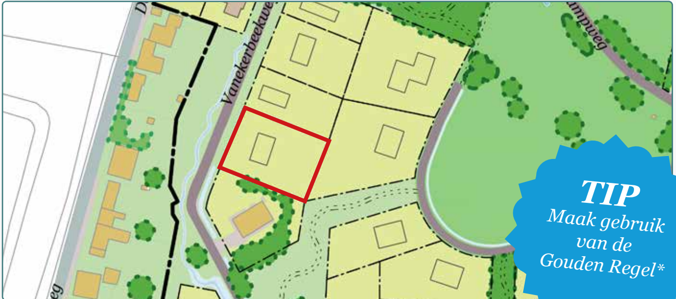
Situatietekening kavel 137