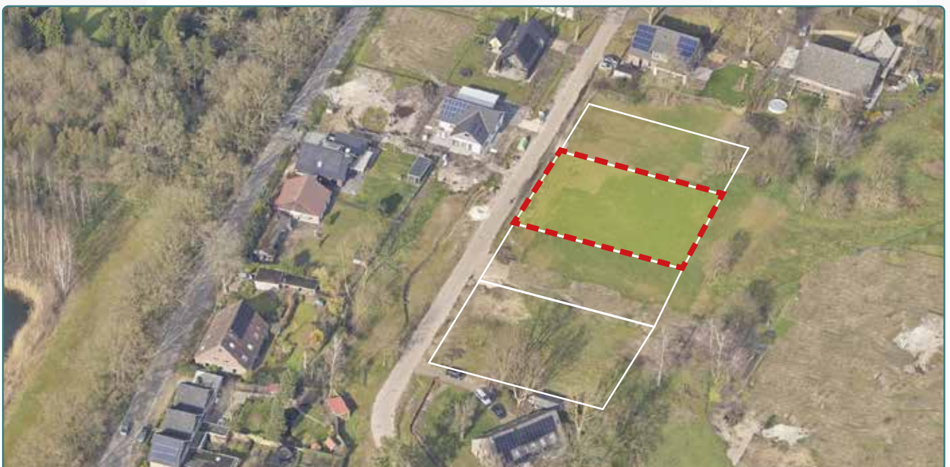
Kavel 135 vanuit de lucht