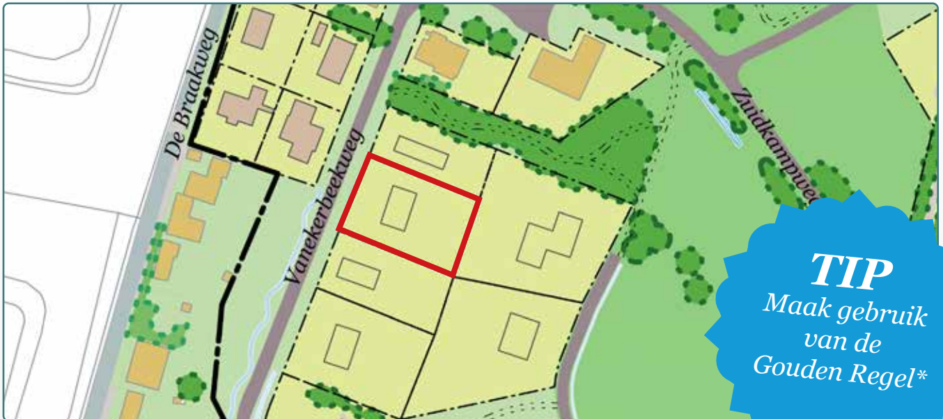
Situatietekening kavel 135