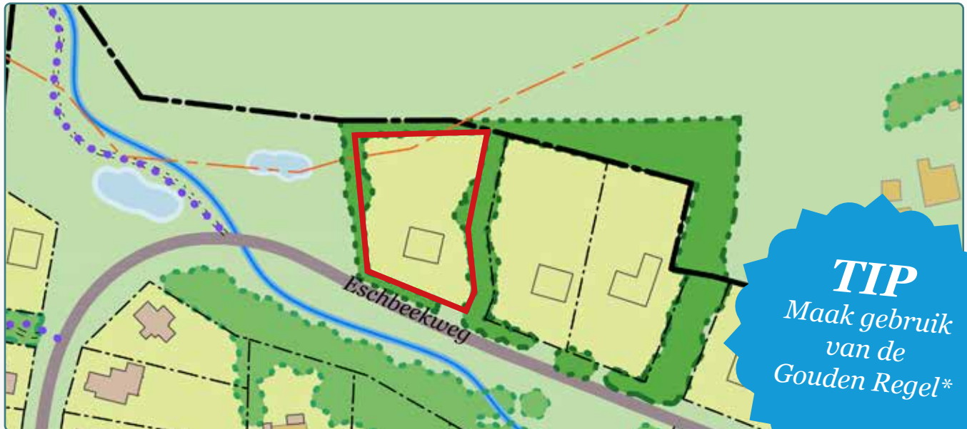
Situatietekening kavel 133

Geurcontour uit geuronderzoek: AH.2017.0916.00.R002, bijlage 4 bestemmingsplan "Vaneker 2019"