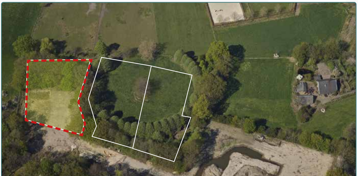
Kavel 133 vanuit de lucht

* De Stadsbouwmeester kan in zijn welstandsadvies afwijken van het beeldkwaliteitplan als de koper c.q architect met een ontwerp (aanvraag omgevingsvergunning) komt dat op onderdelen afwijkt van het beeldkwaliteitplan, maar kwalitatief een verrijking is van 't Vaneker. Dit is ter beoordeling aan de Stadsbouwmeester.