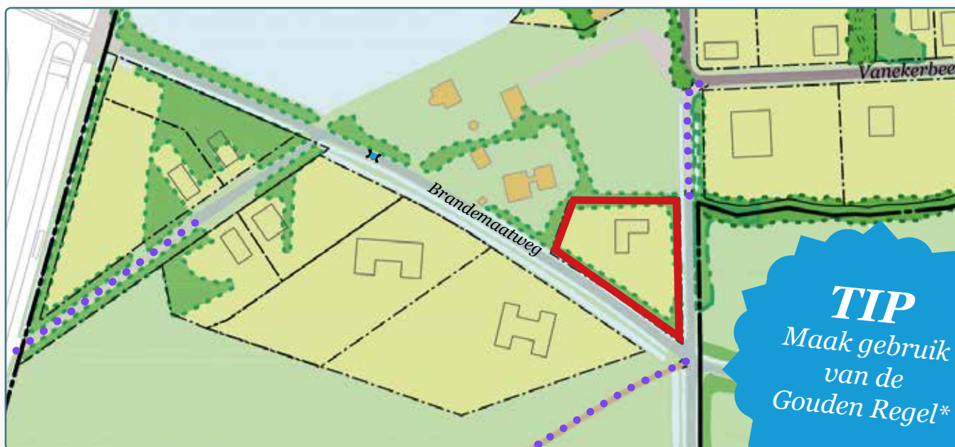
Situatietekening kavel 99