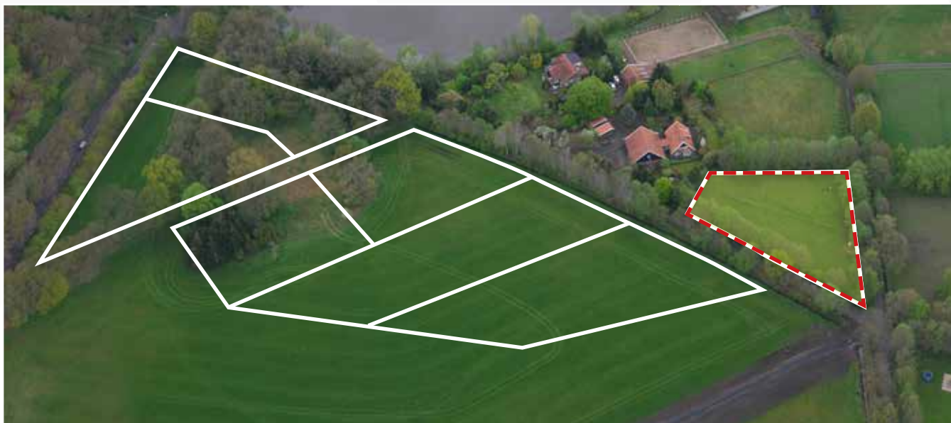
Kavel 99 vanuit de lucht

* De Stadsbouwmeester kan in zijn welstandsadvies afwijken van het beeldkwaliteitplan als de koper c.q architect met een ontwerp (aanvraag omgevingsvergunning) komt dat op onderdelen afwijkt van het beeldkwaliteitplan, maar kwalitatief een verrijking is van 't Vaneker. Dit is ter beoordeling aan de Stadsbouwmeester.