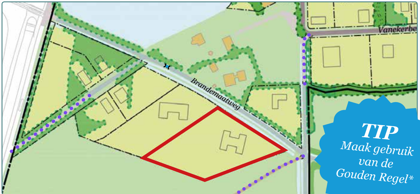
Situatietekening kavel 98