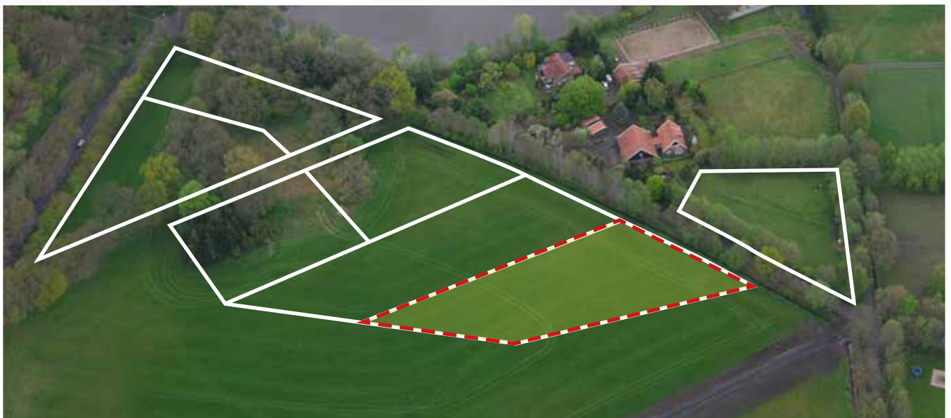
Kavel 98 vanuit de lucht

* De Stadsbouwmeester kan in zijn welstandsadvies afwijken van het beeldkwaliteitplan als de koper c.q architect met een ontwerp (aanvraag omgevingsvergunning) komt dat op onderdelen afwijkt van het beeldkwaliteitplan, maar kwalitatief een verrijking is van 't Vaneker. Dit is ter beoordeling aan de Stadsbouwmeester.