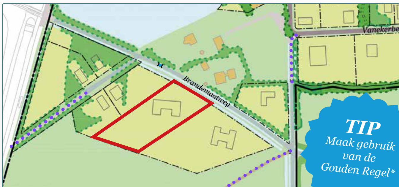
Situatietekening kavel 97