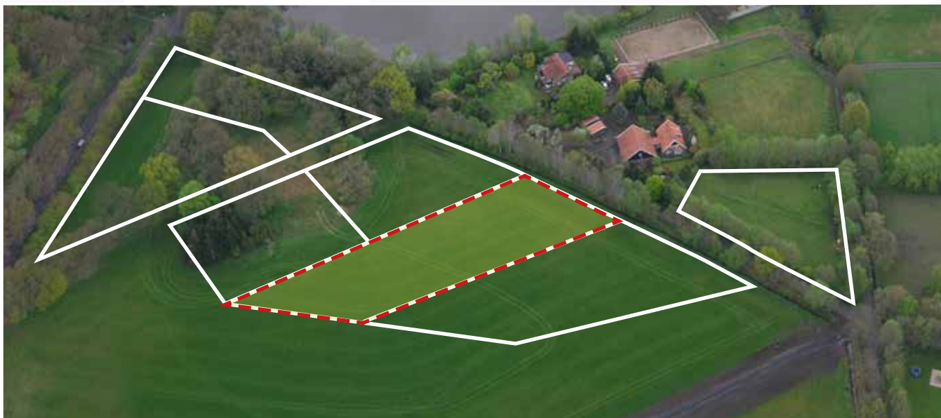
Kavel 97 vanuit de lucht

* De Stadsbouwmeester kan in zijn welstandsadvies afwijken van het beeldkwaliteitplan als de koper c.q architect met een ontwerp (aanvraag omgevingsvergunning) komt dat op onderdelen afwijkt van het beeldkwaliteitplan, maar kwalitatief een verrijking is van 't Vaneker. Dit is ter beoordeling aan de Stadsbouwmeester.