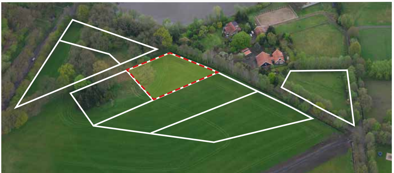
Kavel 95 vanuit de lucht

* De Stadsbouwmeester kan in zijn welstandsadvies afwijken van het beeldkwaliteitplan als de koper c.q architect met een ontwerp (aanvraag omgevingsvergunning) komt dat op onderdelen afwijkt van het beeldkwaliteitplan, maar kwalitatief een verrijking is van 't Vaneker. Dit is ter beoordeling aan de Stadsbouwmeester.