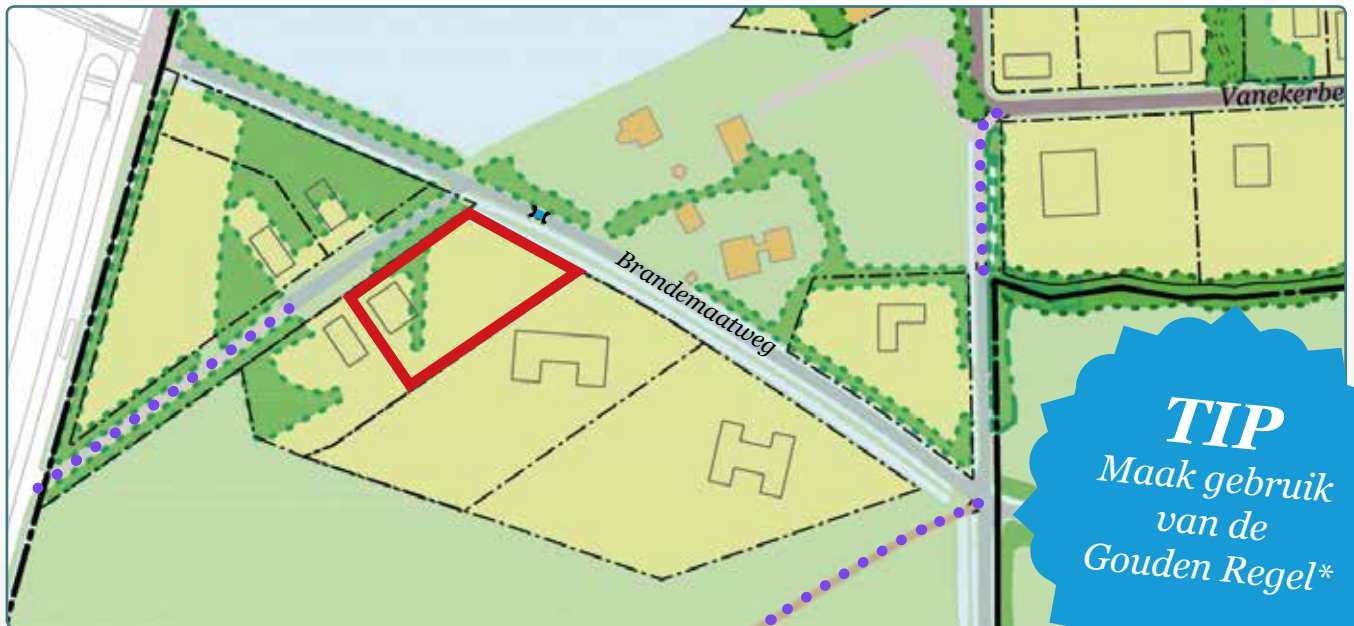
Situatietekening kavel 95