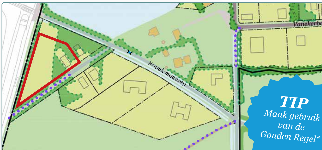
Situatietekening kavel 94