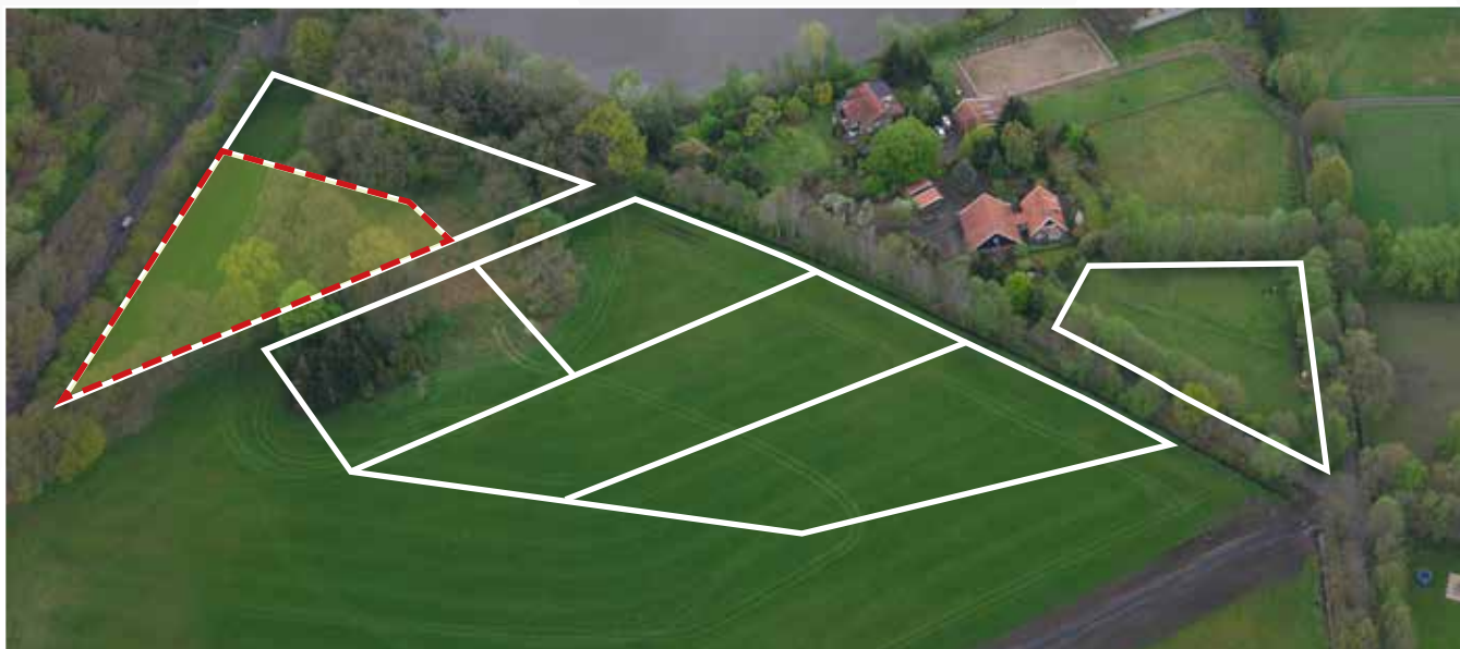
Kavel 94 vanuit de lucht