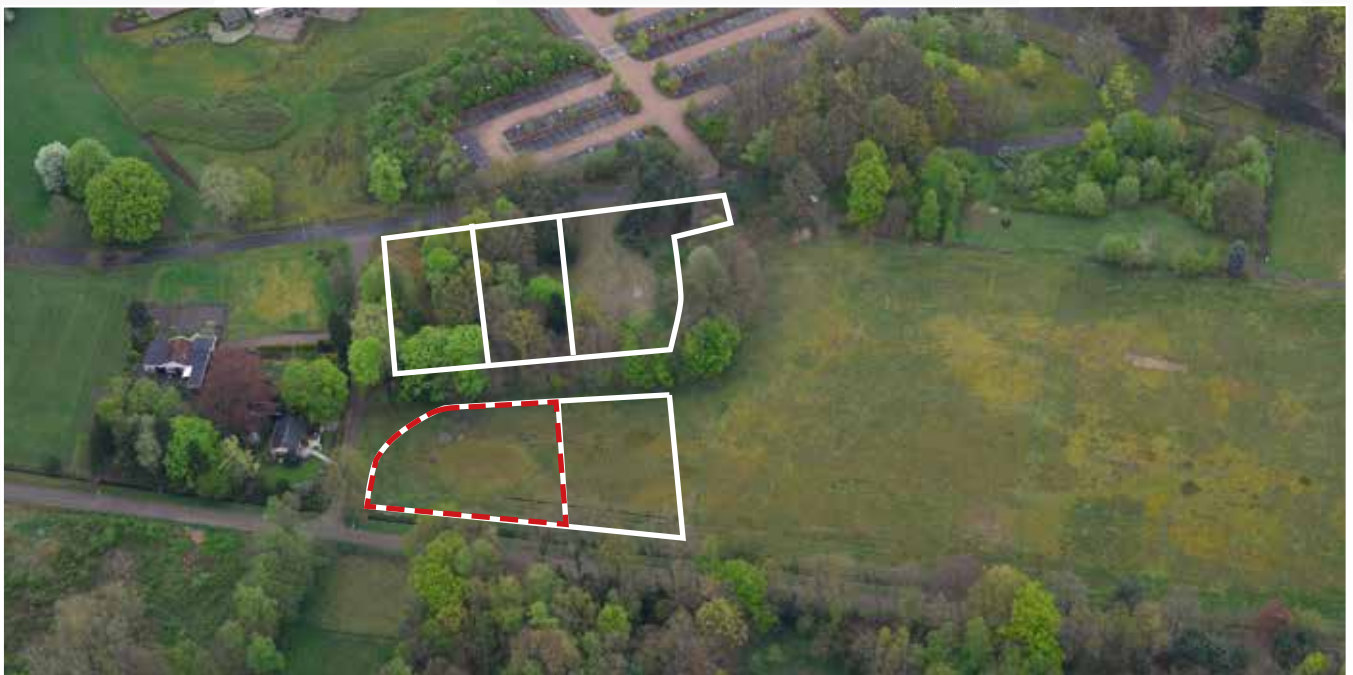
Kavel 92 vanuit de lucht