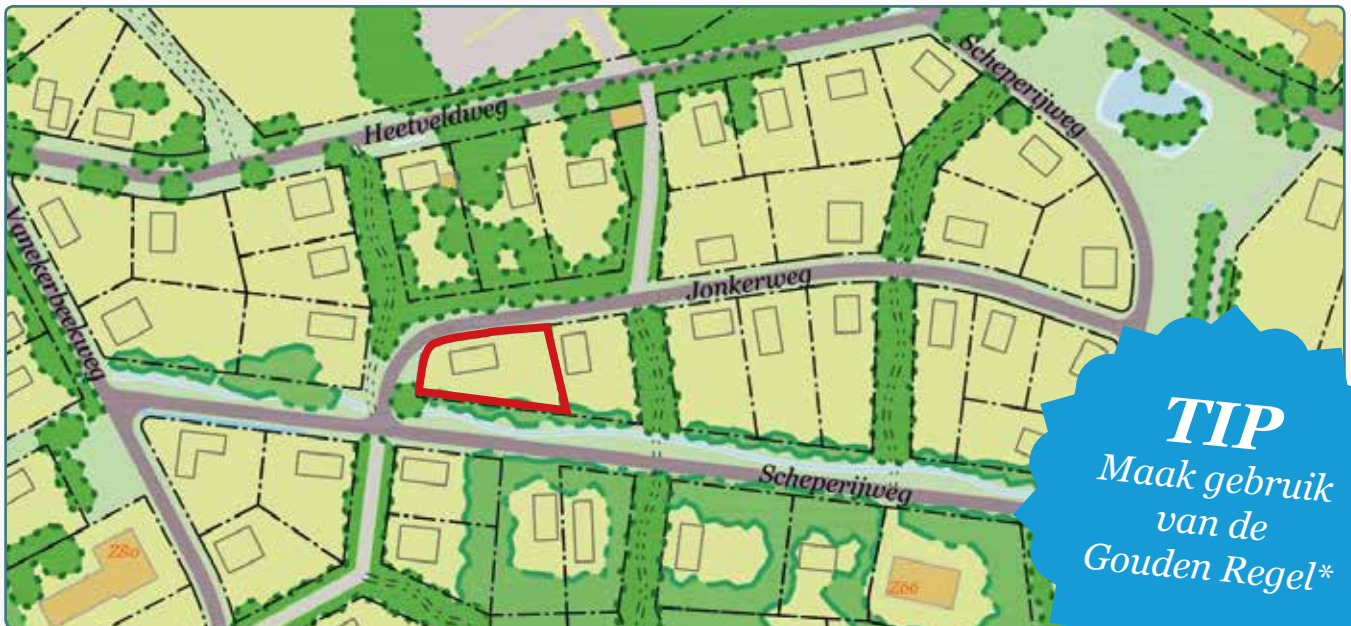
Situatietekening kavel 92