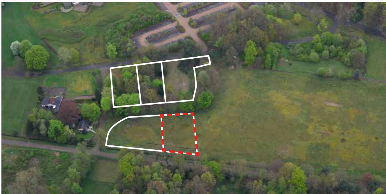
Kavel 91 vanuit de lucht