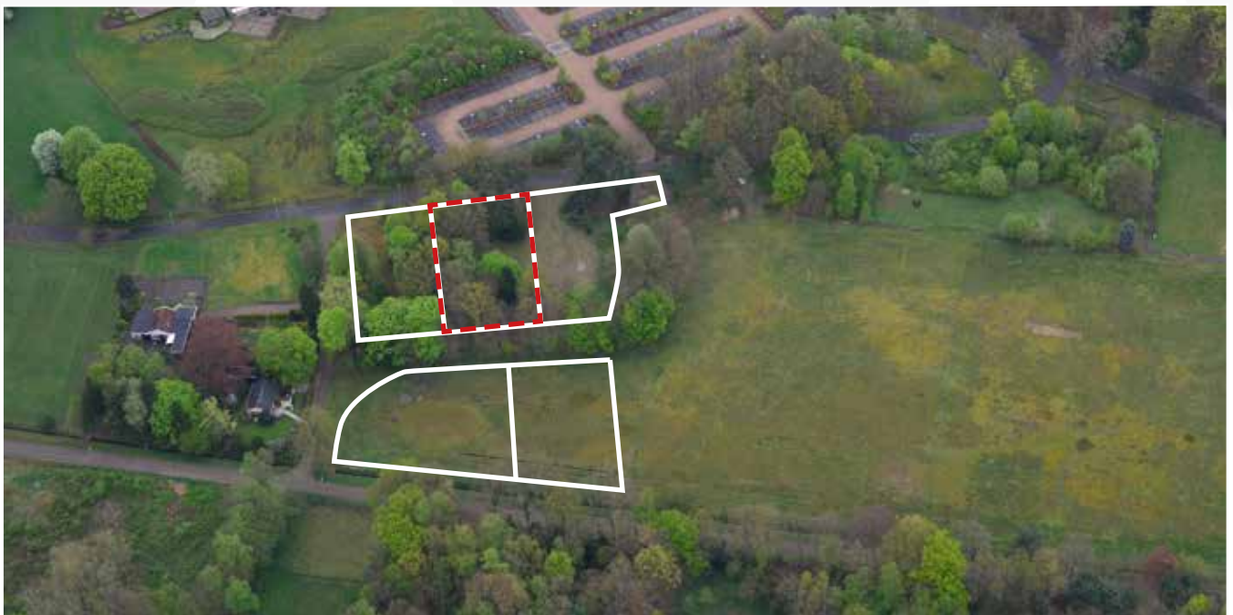
Kavel 89 vanuit de lucht