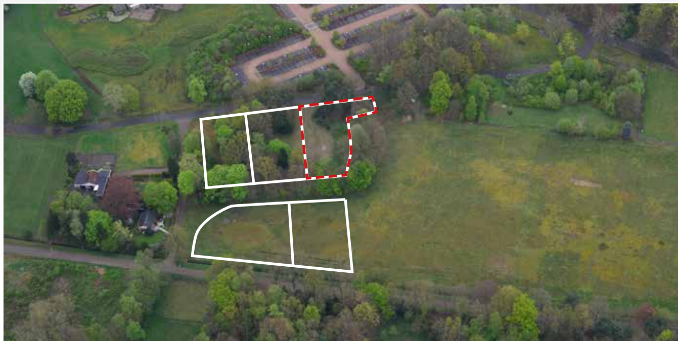
Kavel 88 vanuit de lucht