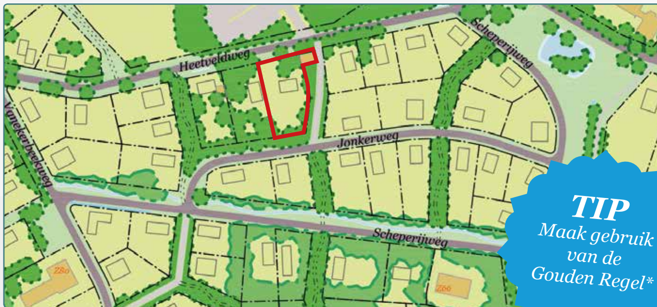
Situatietekening kavel 88