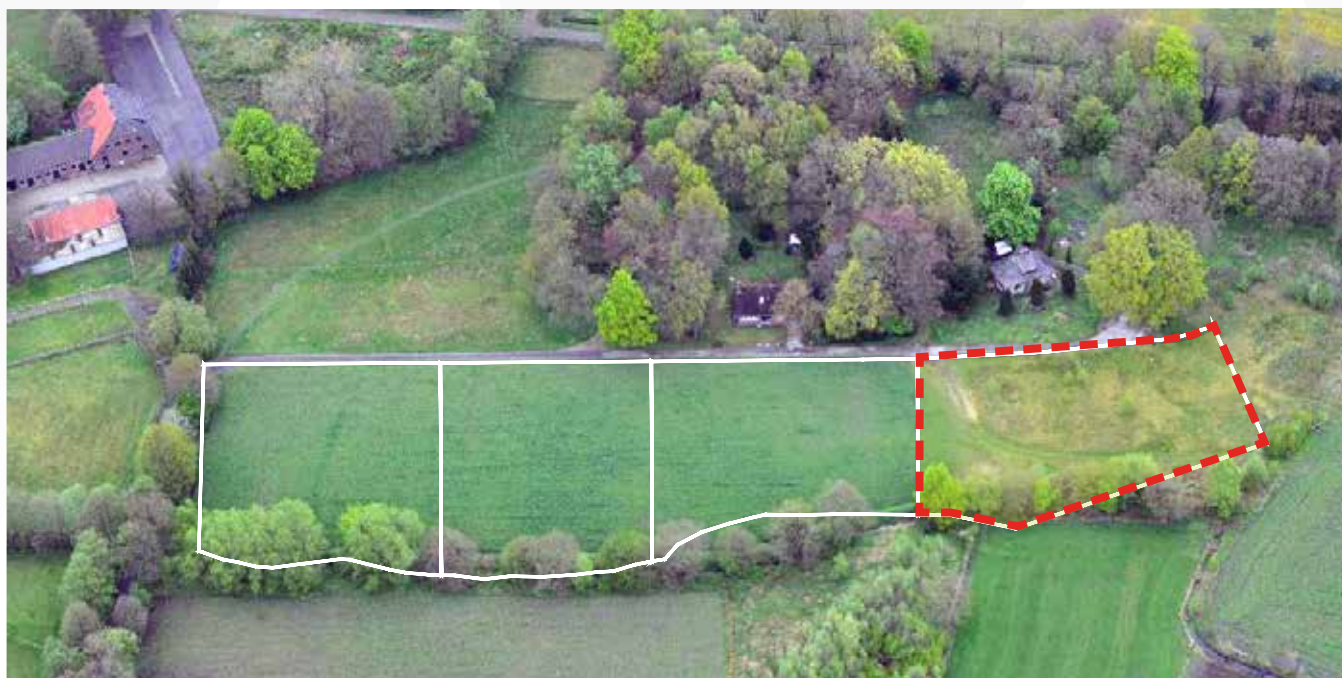
Kavel 87 vanuit de lucht