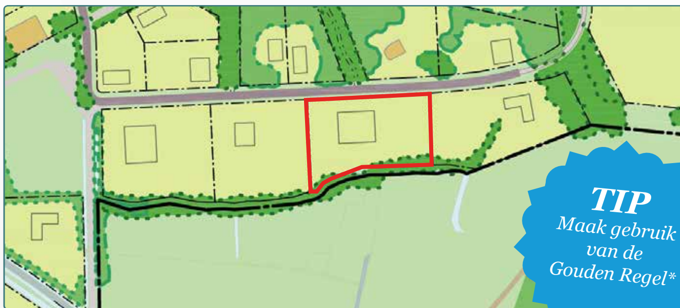
Situatietekening kavel 86