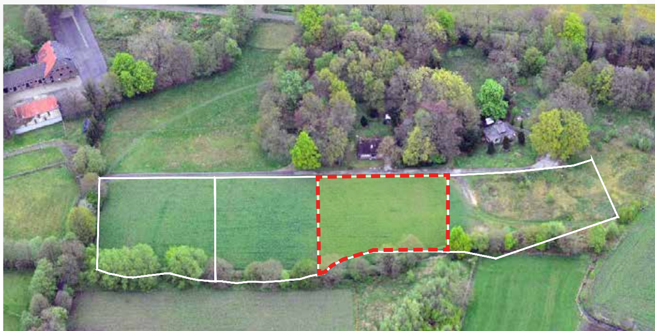
Kavel 86 vanuit de lucht