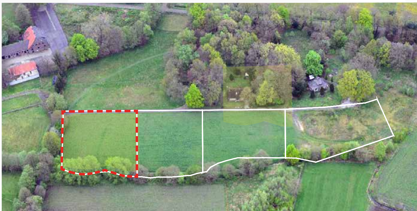
Kavel 84 vanuit de lucht