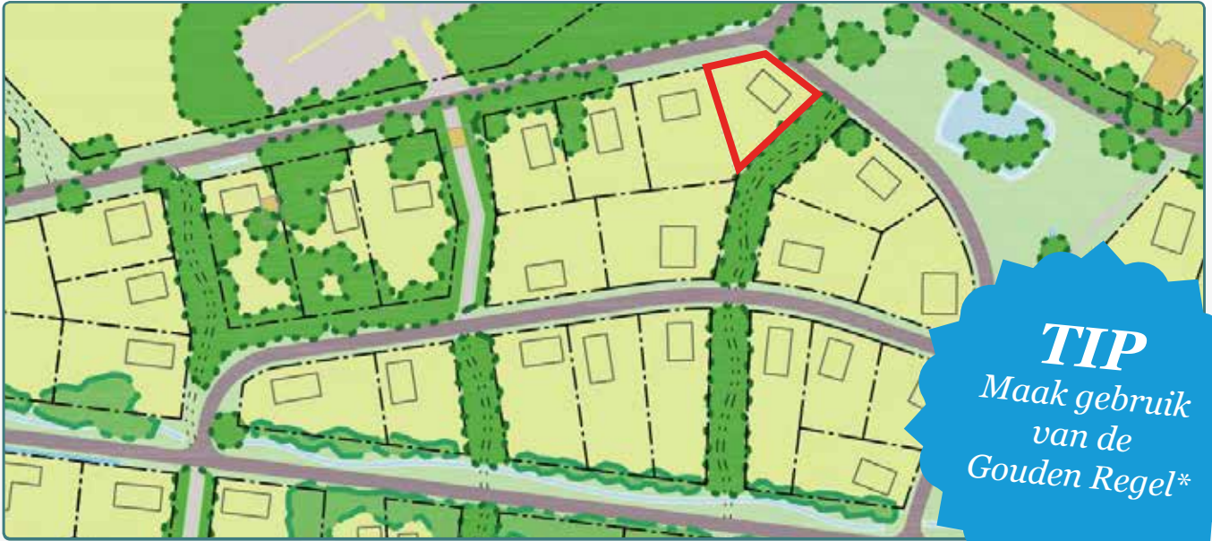
Situatietekening kavel 83