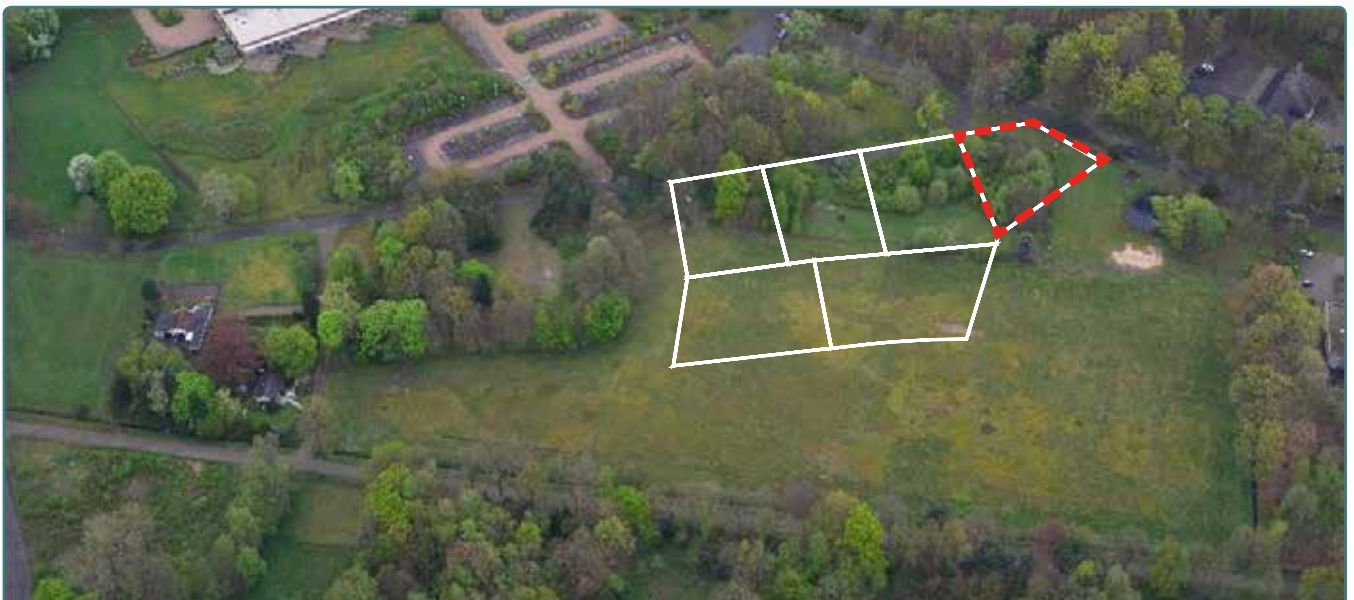
Kavel 83 vanuit de lucht