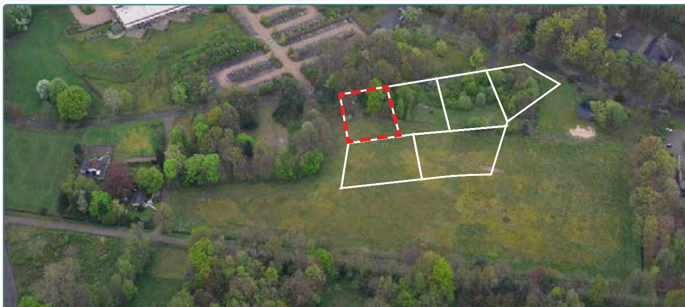
Kavel 80 vanuit de lucht