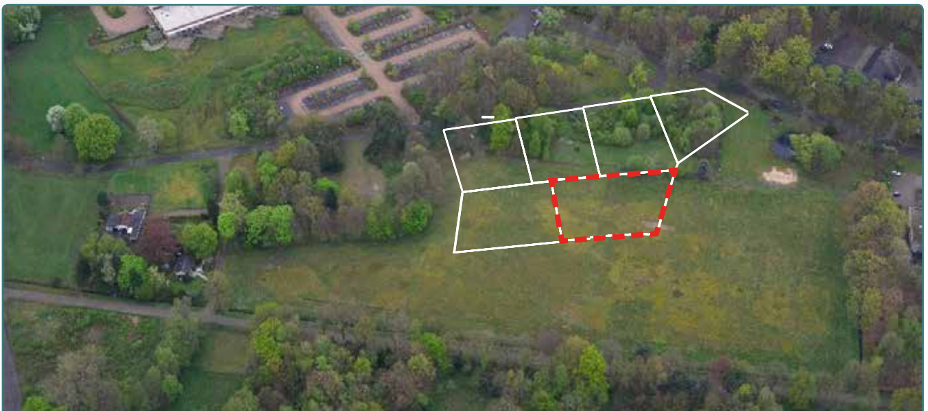
Kavel 79 vanuit de lucht