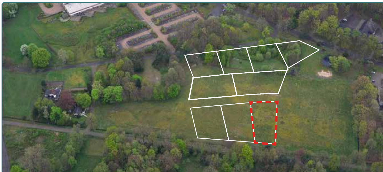
Kavel 77 vanuit de lucht