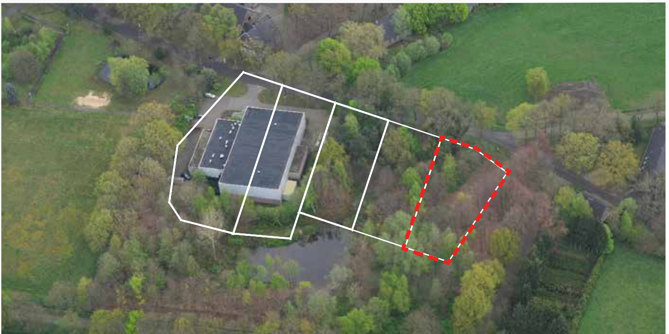
Kavel 74 vanuit de lucht