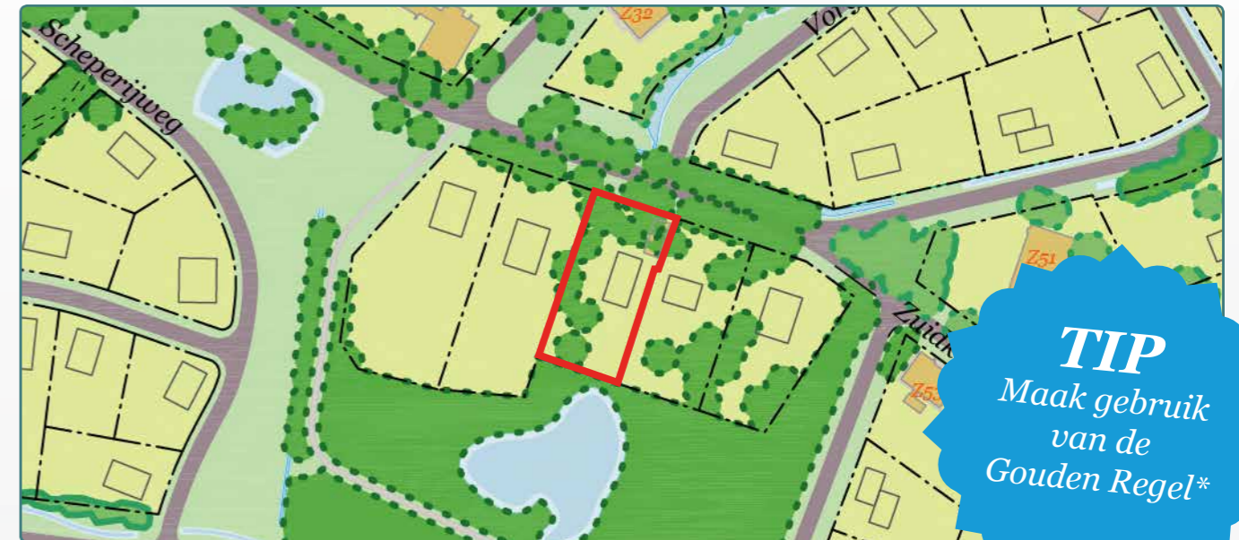
Situatietekening kavel 72