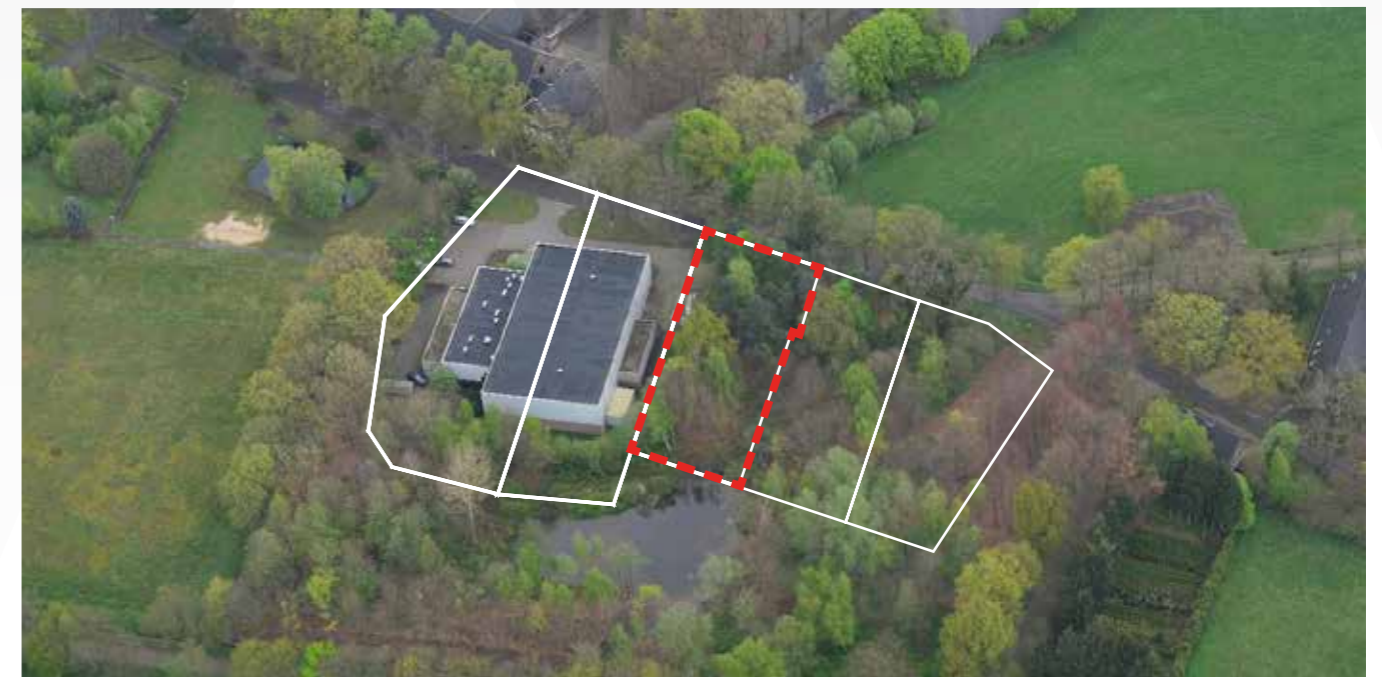
Kavel 72 vanuit de lucht