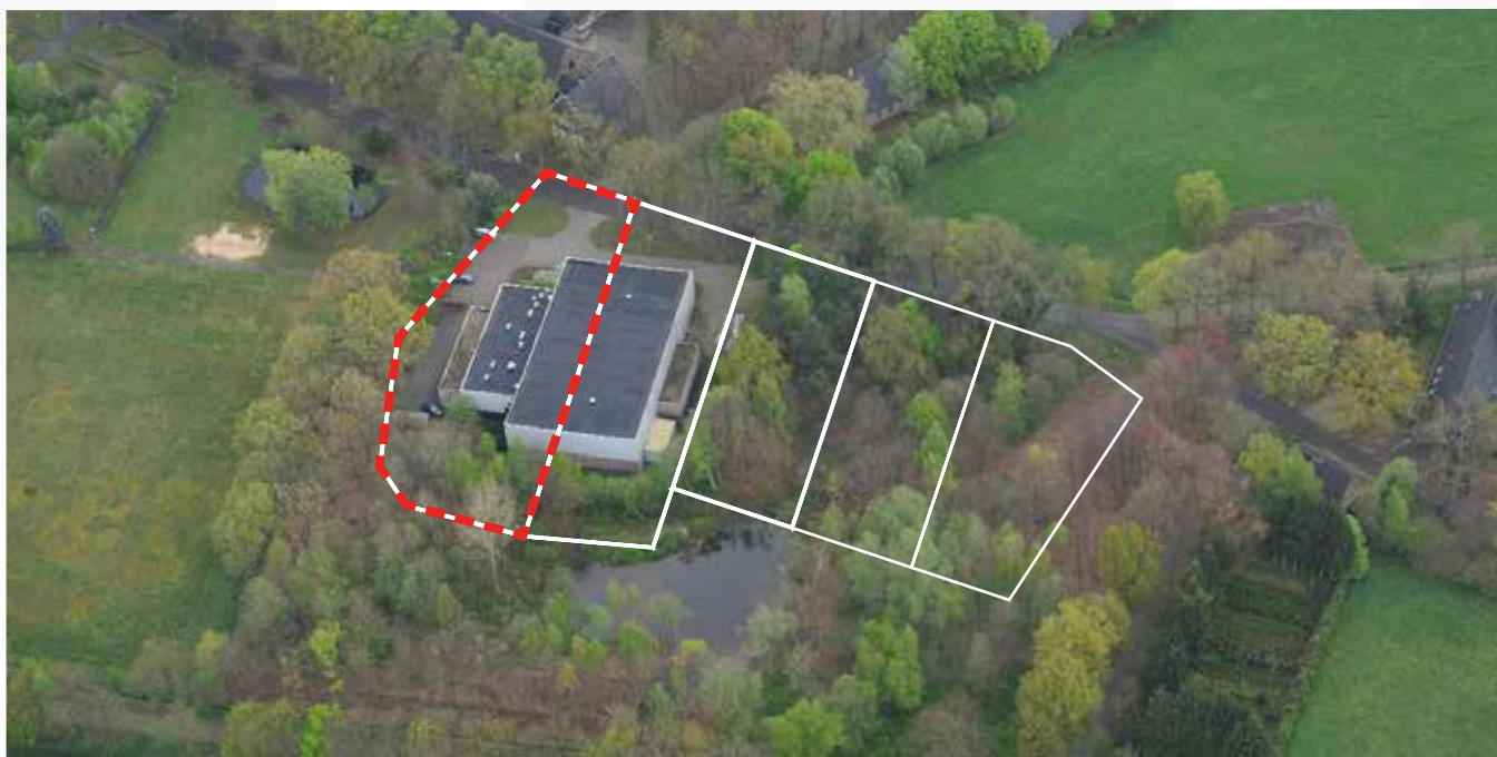
Kavel 70 vanuit de lucht