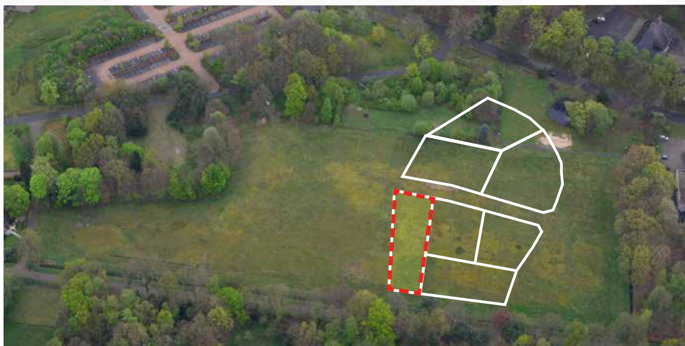
Kavel 68 vanuit de lucht