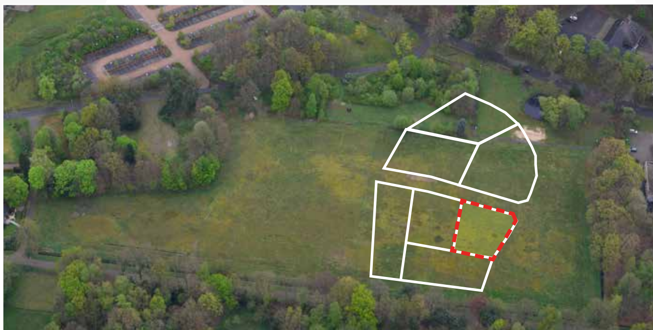
Kavel 66 vanuit de lucht