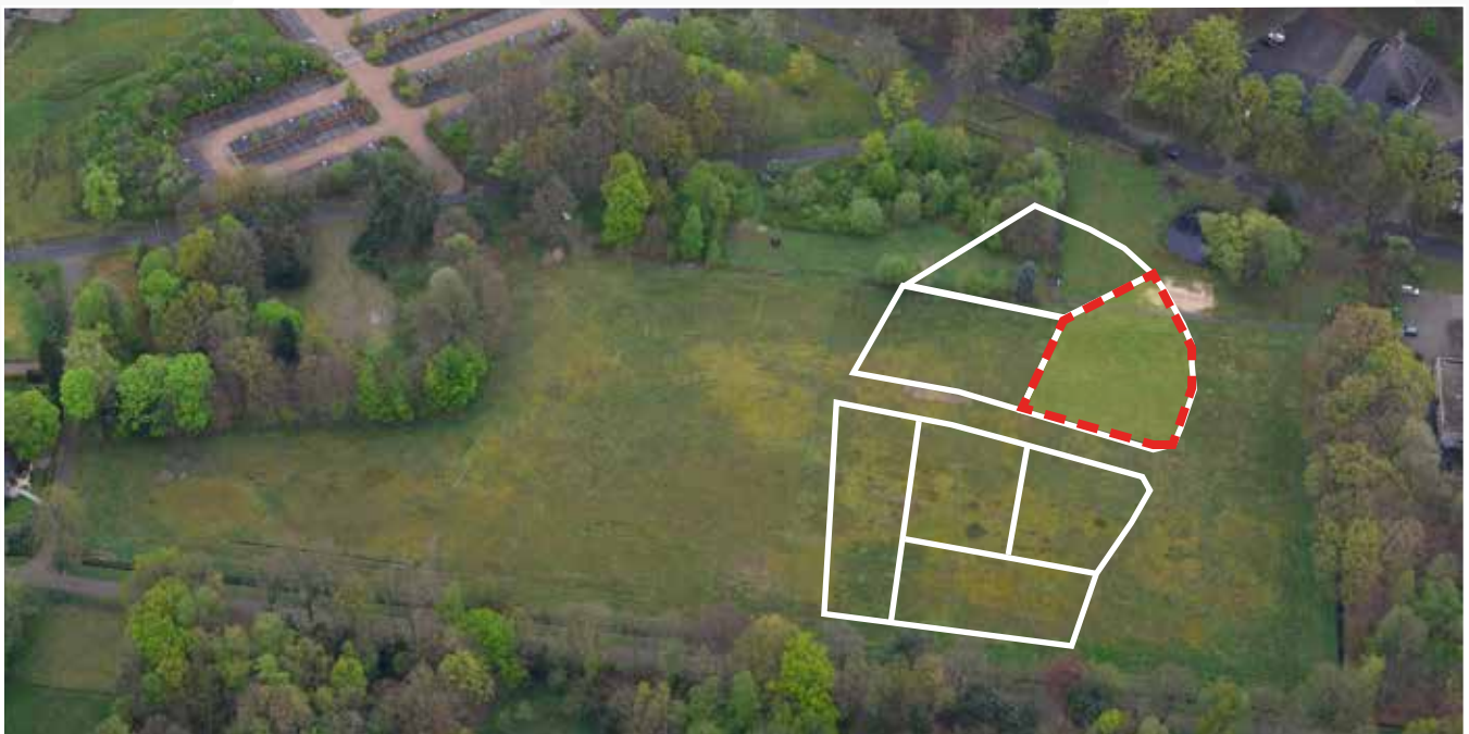
Kavel 65 vanuit de lucht