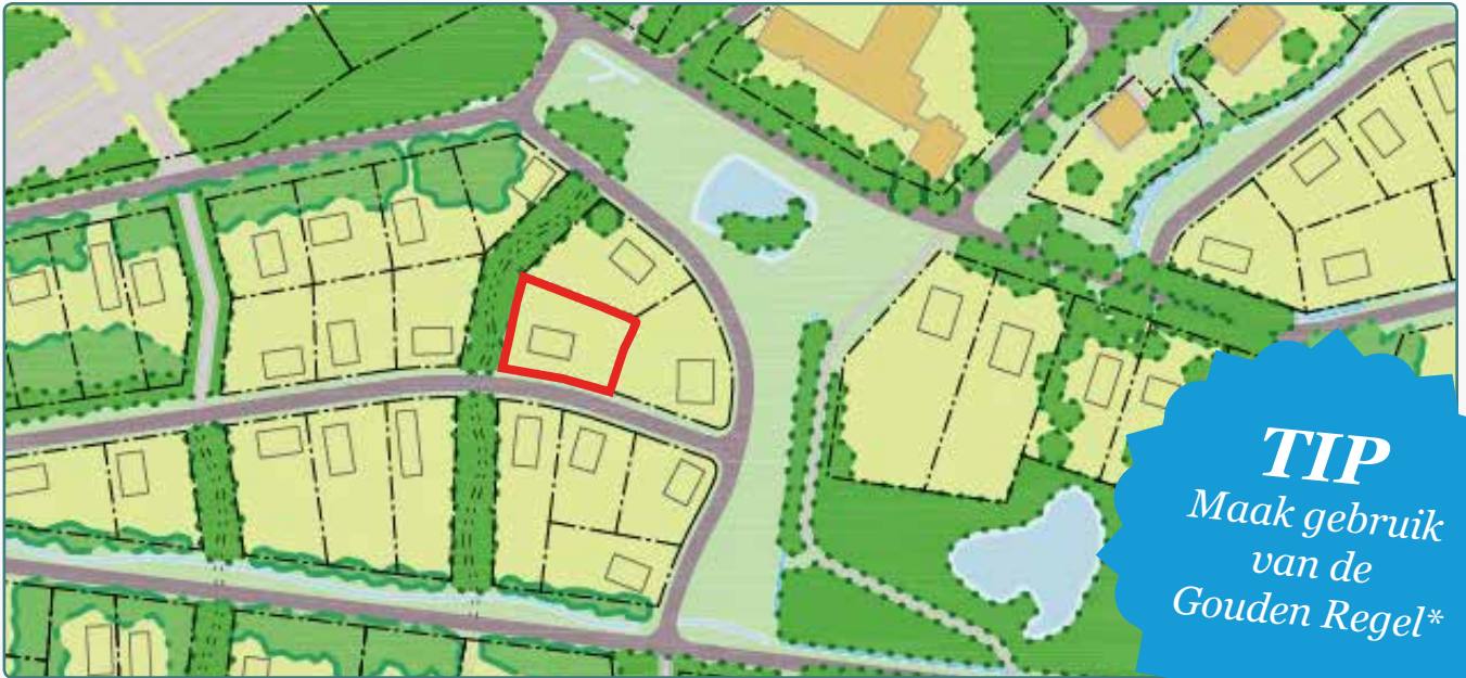
Situatietekening kavel 64