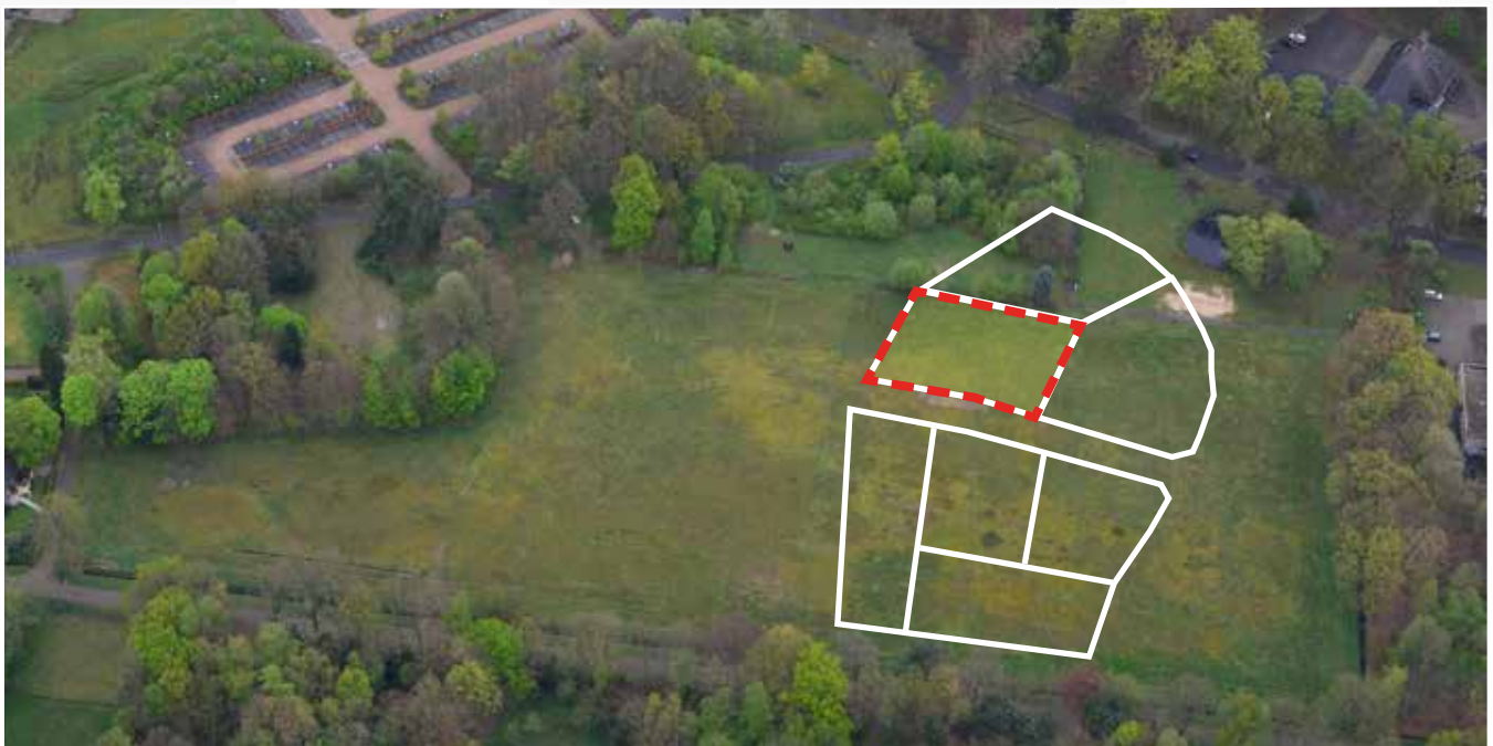
Kavel 64 vanuit de lucht