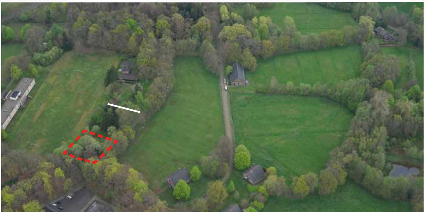
Kavel 62 vanuit de lucht