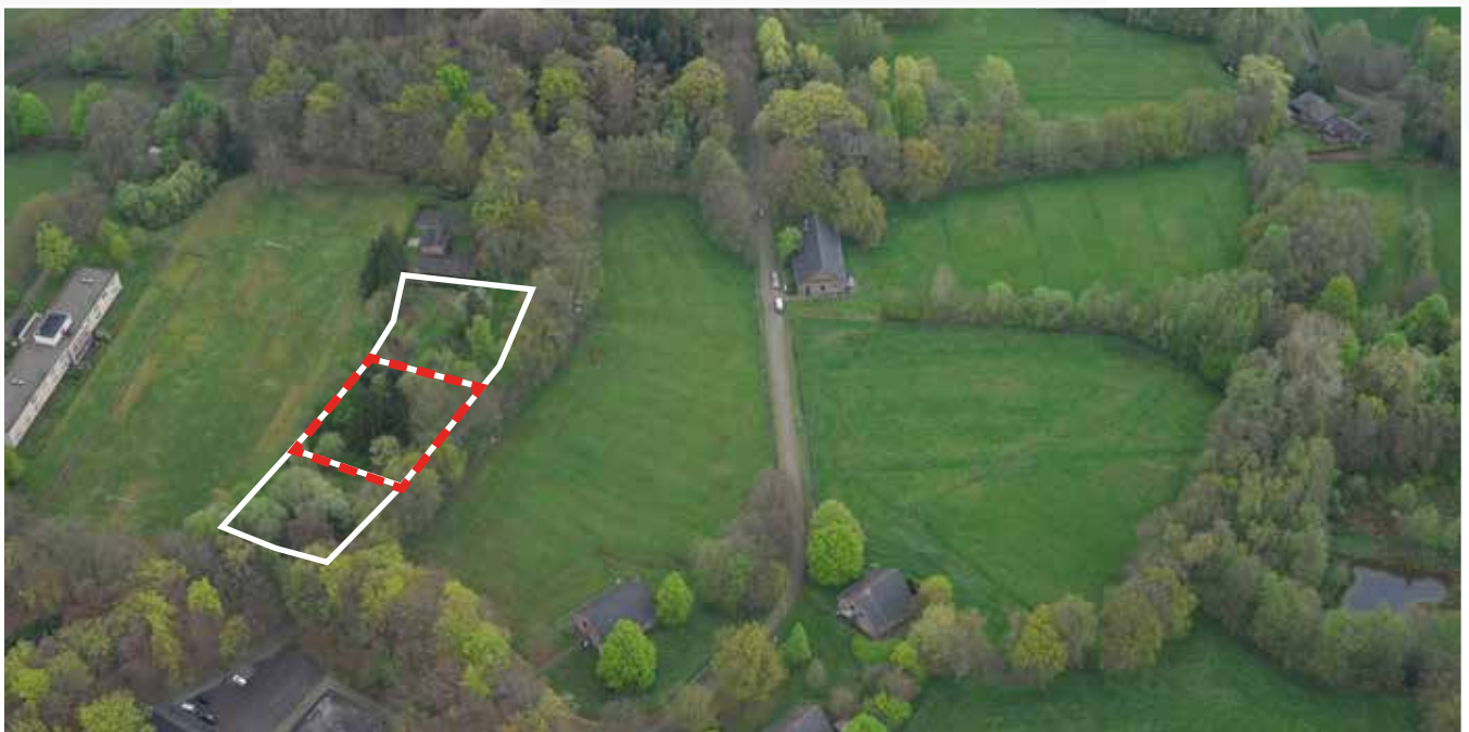
Kavel 61 vanuit de lucht