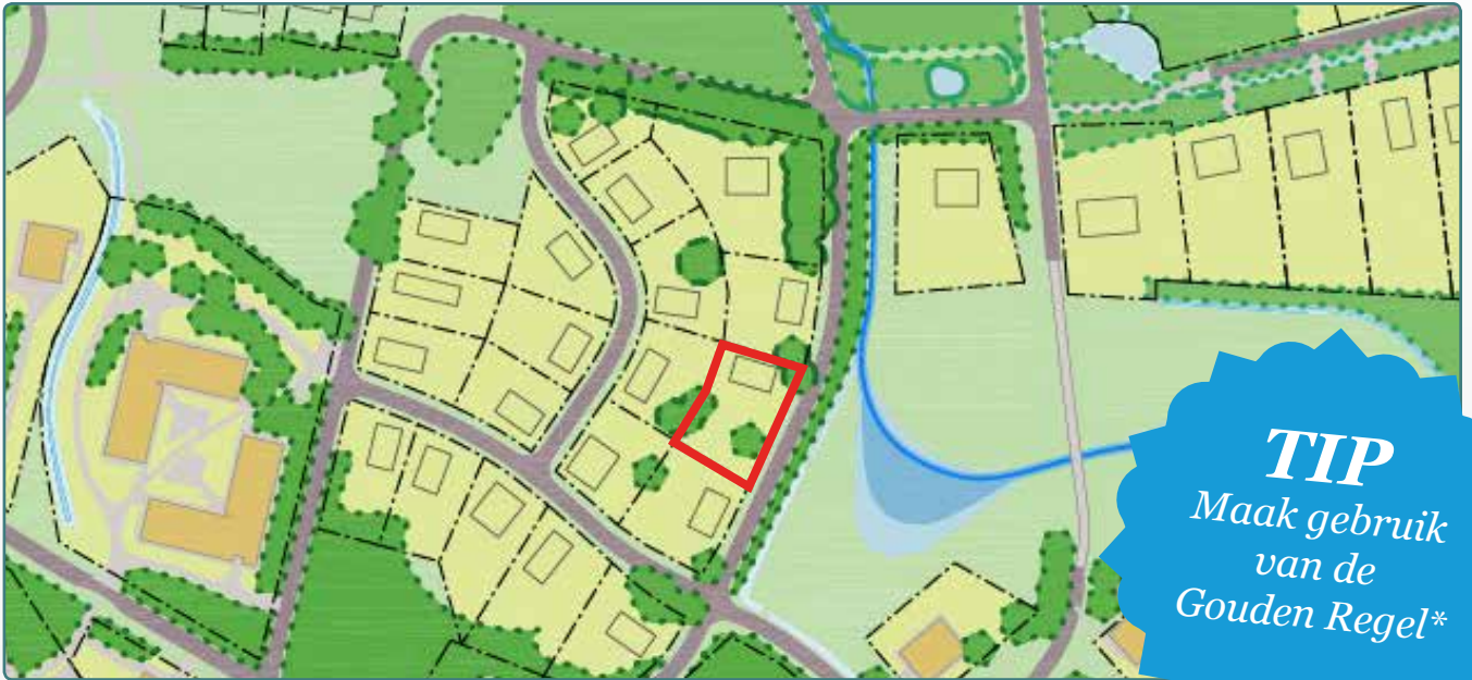
Situatietekening kavel 61