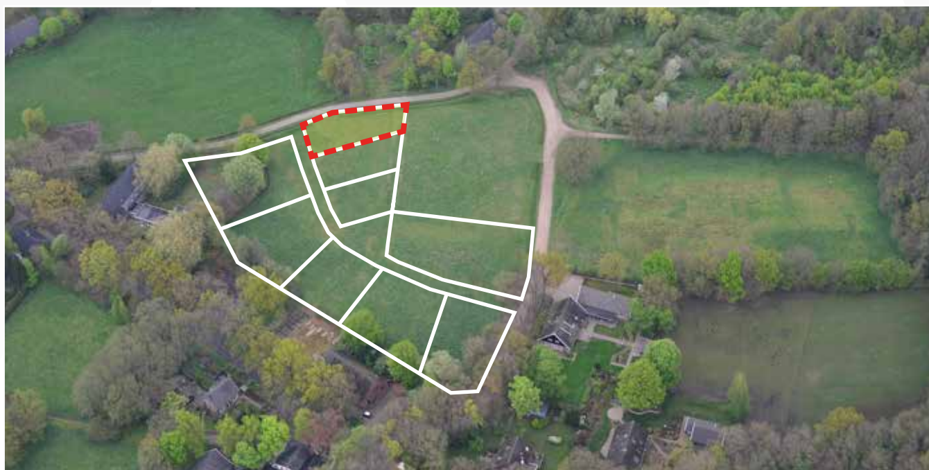
Kavel 06 vanuit de lucht