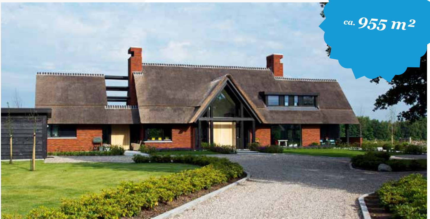
Oude Lenferink Tubbergen