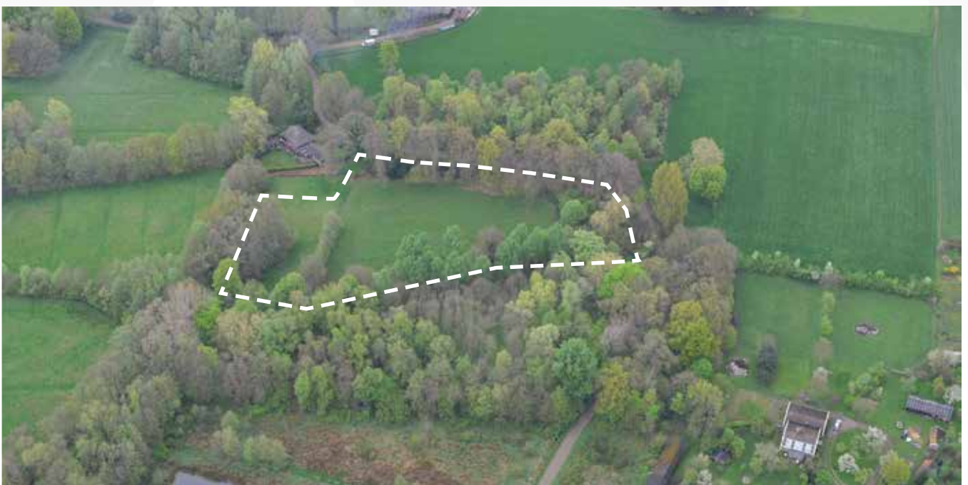
Kavel 59 vanuit de lucht