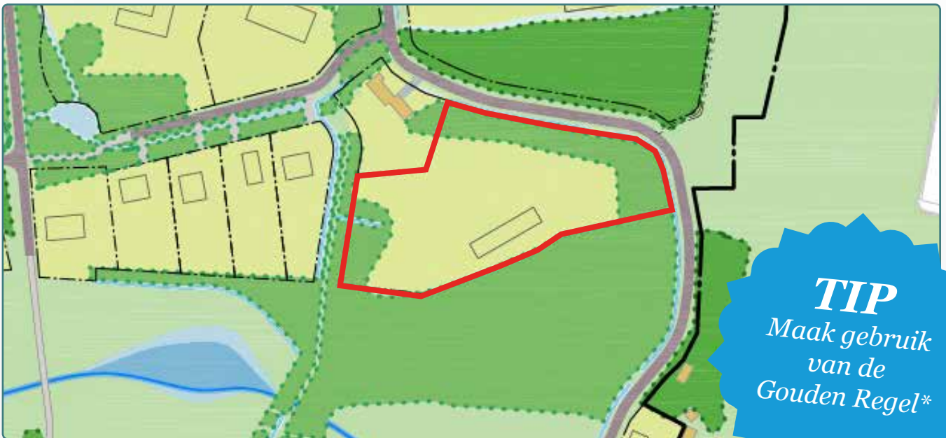
Situatietekening kavel 59