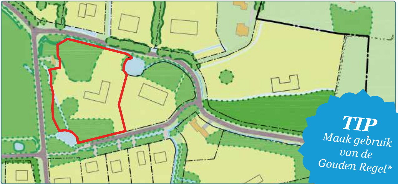
Situatietekening kavel 57