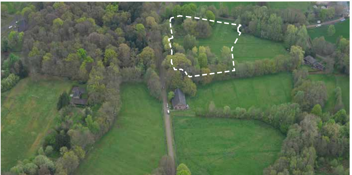
Kavel 57 vanuit de lucht