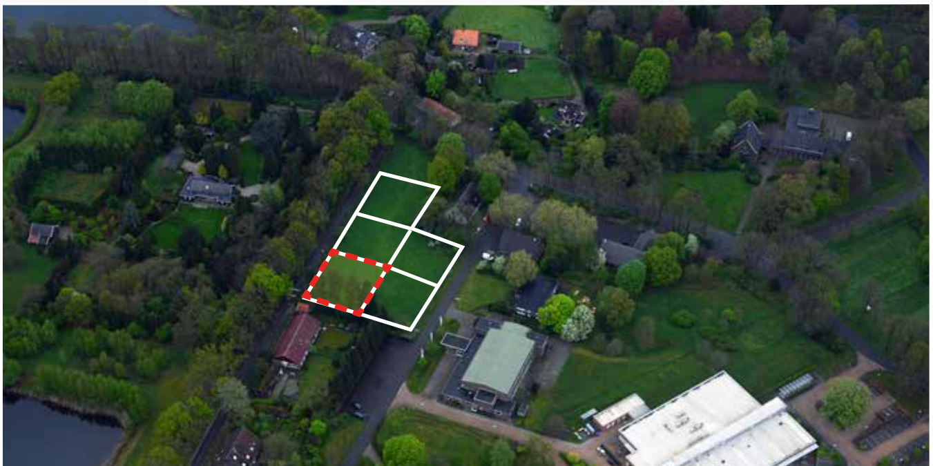
Kavel 54 vanuit de lucht