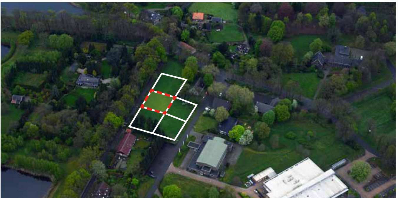
Kavel 53 vanuit de lucht