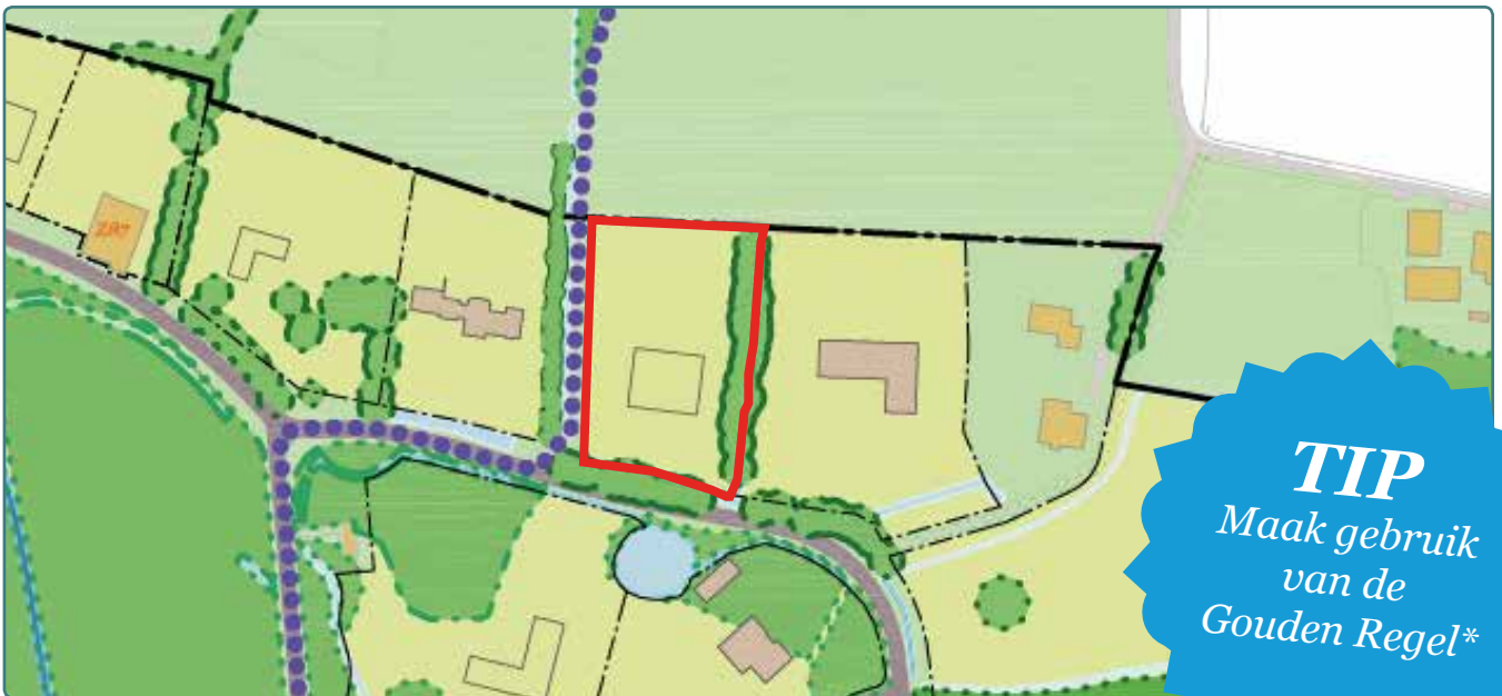
Situatietekening kavel 49