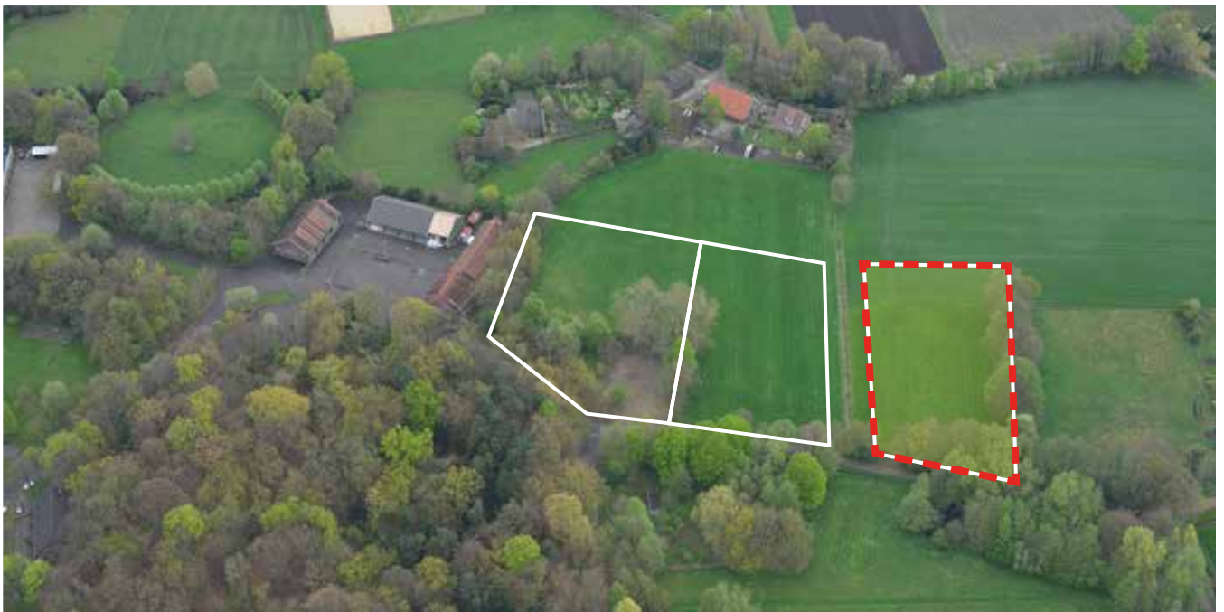
Kavel 49 vanuit de lucht