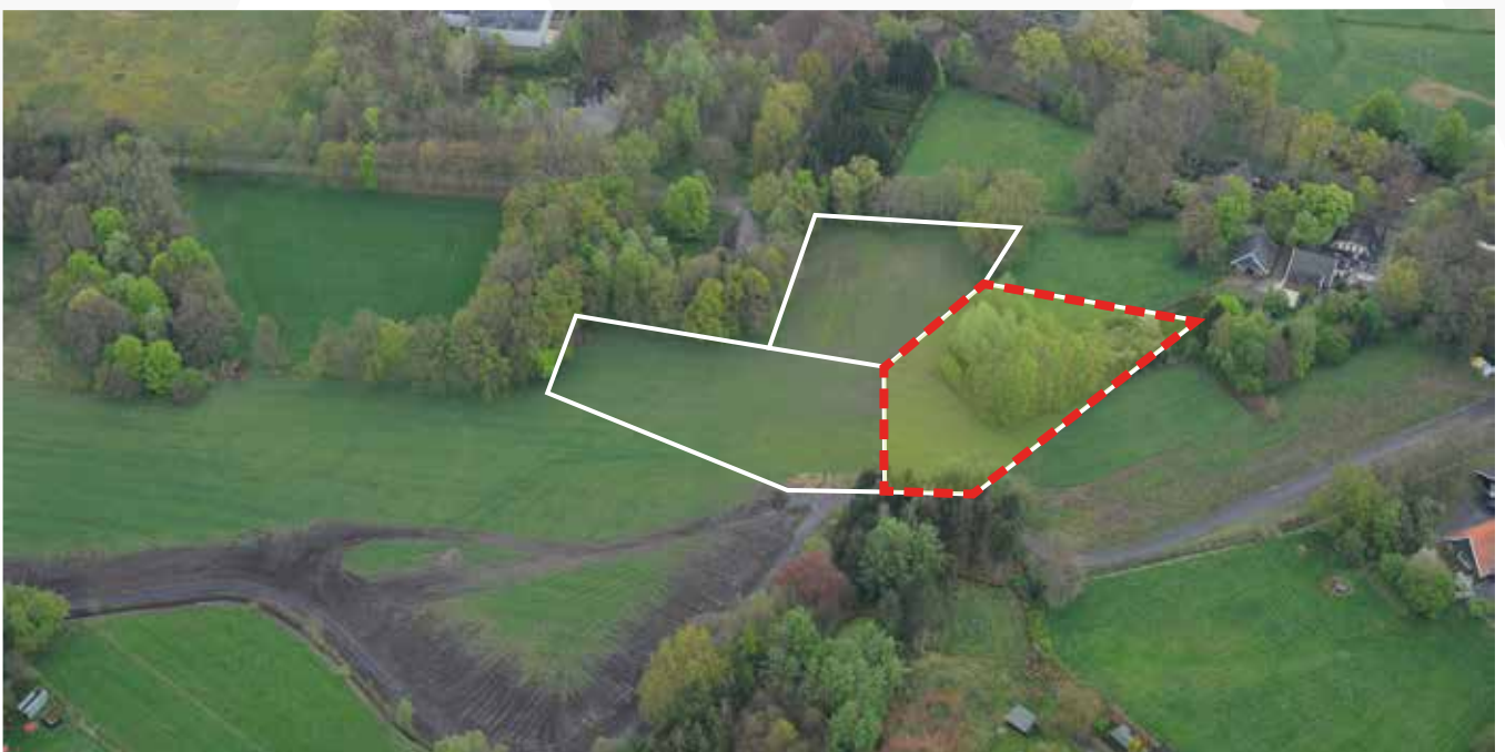
Kavel 41 vanuit de lucht