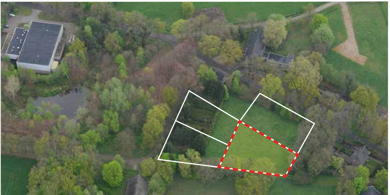
Kavel 36 vanuit de lucht