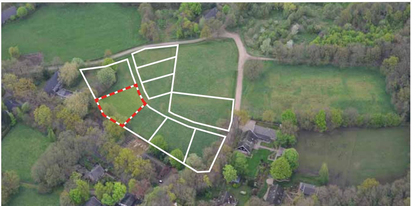
Kavel 19 vanuit de lucht