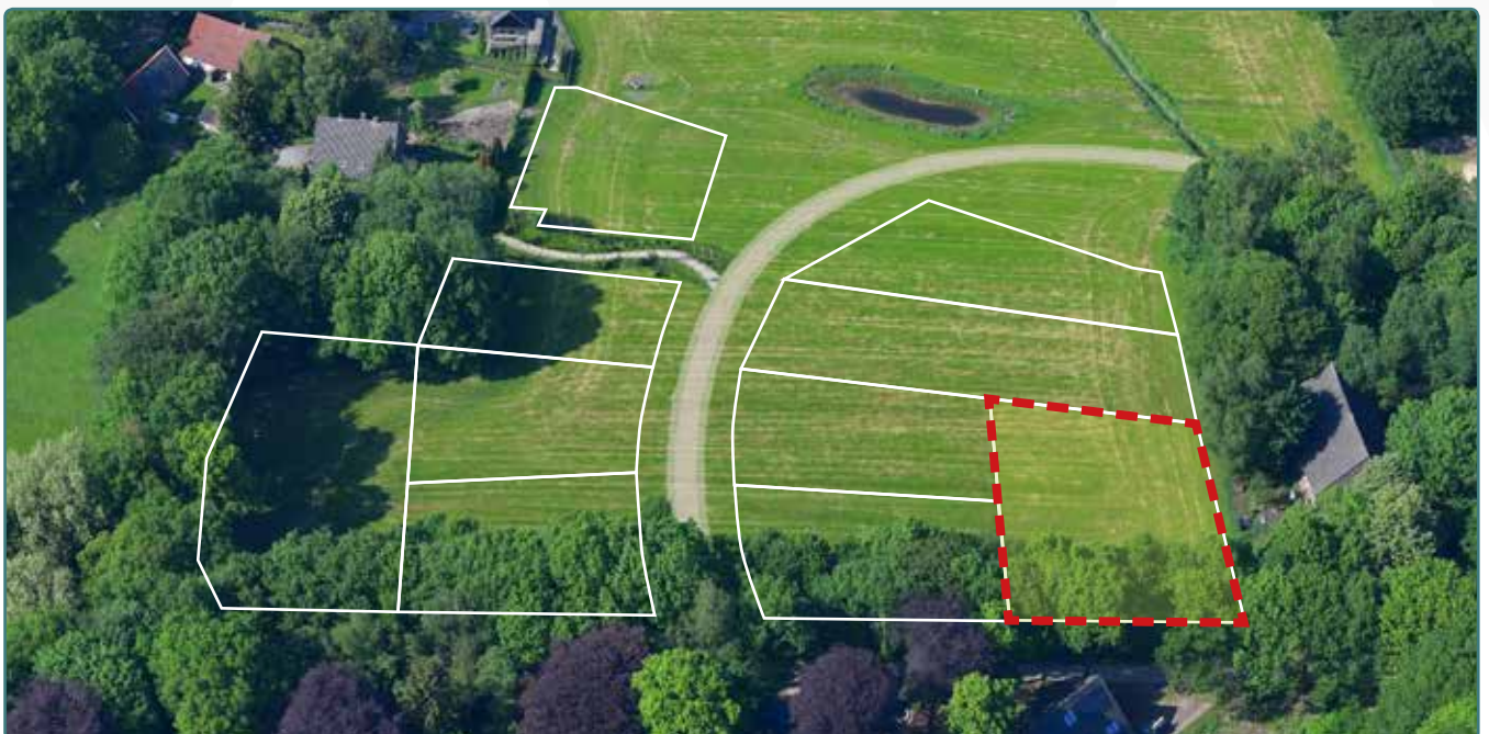
Kavel 127 vanuit de lucht

* De Stadsbouwmeester kan in zijn welstandsadvies afwijken van het beeldkwaliteitplan als de koper c.q architect met een ontwerp (aanvraag omgevingsvergunning) komt dat op onderdelen afwijkt van het beeldkwaliteitplan, maar kwalitatief een verrijking is van 't Vaneker. Dit is ter beoordeling aan de Stadsbouwmeester.