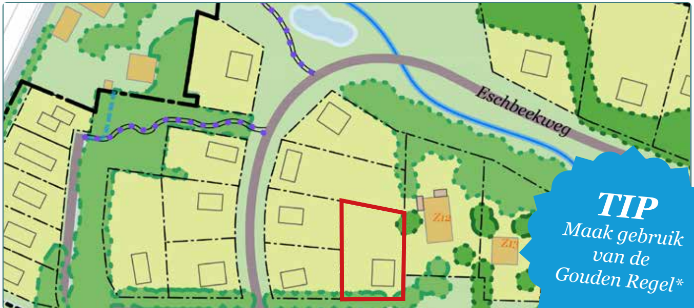
Situatietekening kavel 127