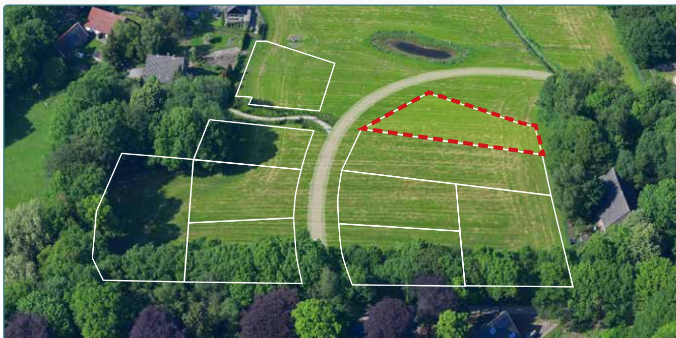
Kavel 126 vanuit de lucht

* De Stadsbouwmeester kan in zijn welstandsadvies afwijken van het beeldkwaliteitplan als de koper c.q architect met een ontwerp (aanvraag omgevingsvergunning) komt dat op onderdelen afwijkt van het beeldkwaliteitplan, maar kwalitatief een verrijking is van 't Vaneker. Dit is ter beoordeling aan de Stadsbouwmeester.