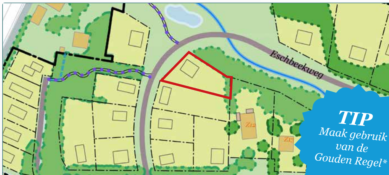
Situatietekening kavel 126