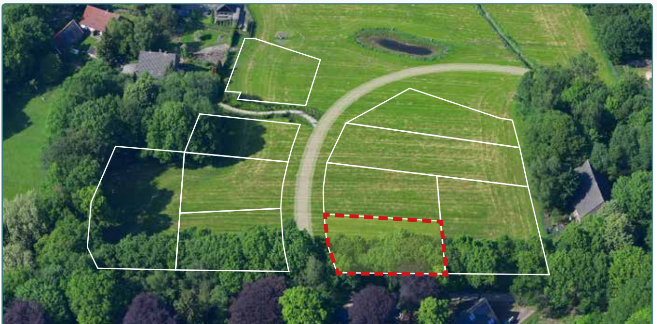
Kavel 123 vanuit de lucht

* De Stadsbouwmeester kan in zijn welstandsadvies afwijken van het beeldkwaliteitplan als de koper c.q architect met een ontwerp (aanvraag omgevingsvergunning) komt dat op onderdelen afwijkt van het beeldkwaliteitplan, maar kwalitatief een verrijking is van 't Vaneker. Dit is ter beoordeling aan de Stadsbouwmeester.