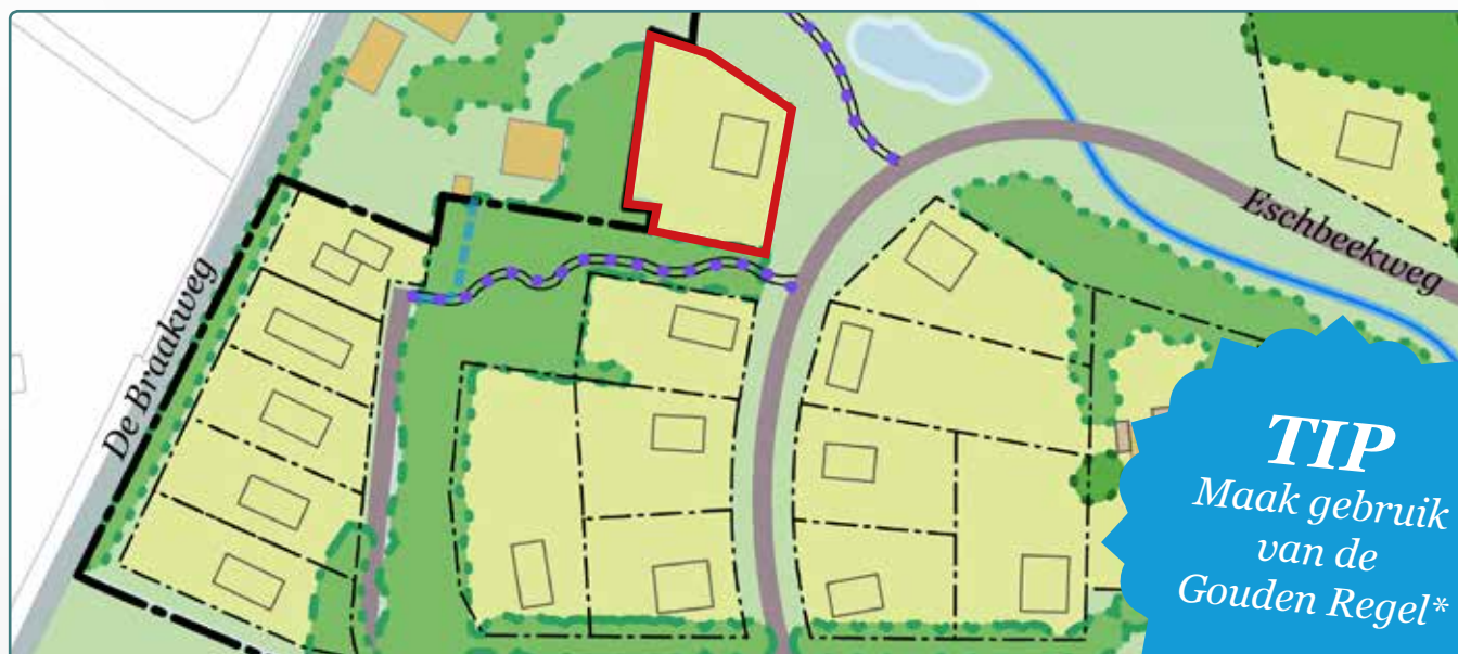
Situatietekening kavel 122