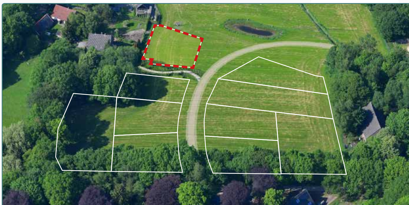
Kavel 122 vanuit de lucht

* De Stadsbouwmeester kan in zijn welstandsadvies afwijken van het beeldkwaliteitplan als de koper c.q architect met een ontwerp (aanvraag omgevingsvergunning) komt dat op onderdelen afwijkt van het beeldkwaliteitplan, maar kwalitatief een verrijking is van 't Vaneker. Dit is ter beoordeling aan de Stadsbouwmeester.