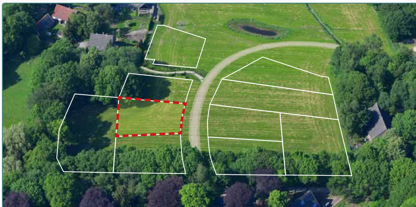
Kavel 120 vanuit de lucht