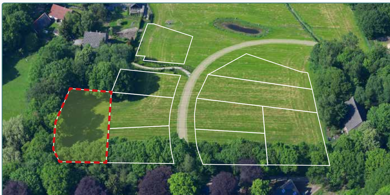
Kavel 118 vanuit de lucht