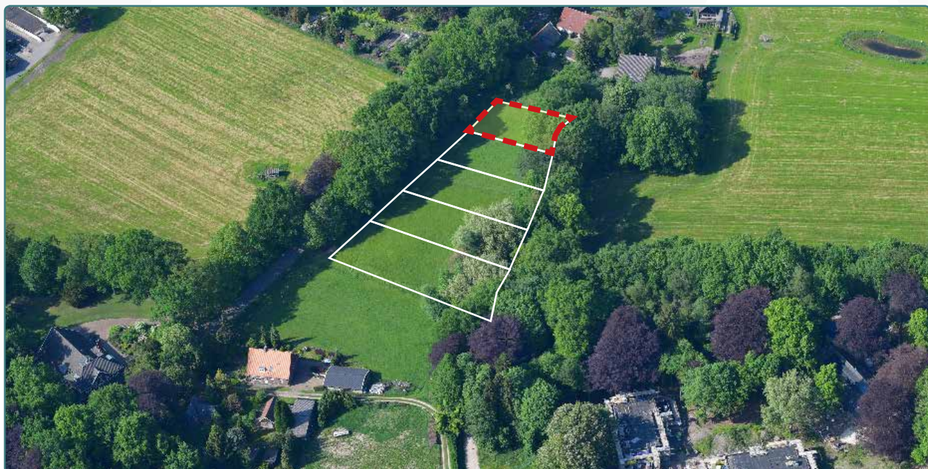
Kavel 117 vanuit de lucht